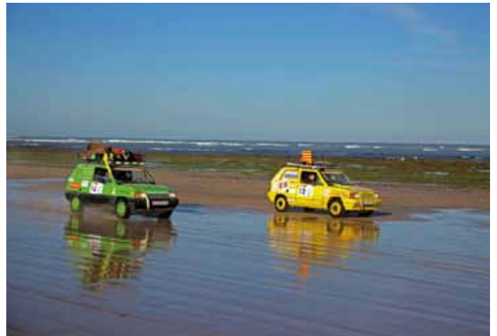
• Molt a prop d'Essaouira, al sud del Marroc. El rally passava a tocar de la costa de l'Atlàntic en una zona coneguda per la lluminositat i el vent continuat