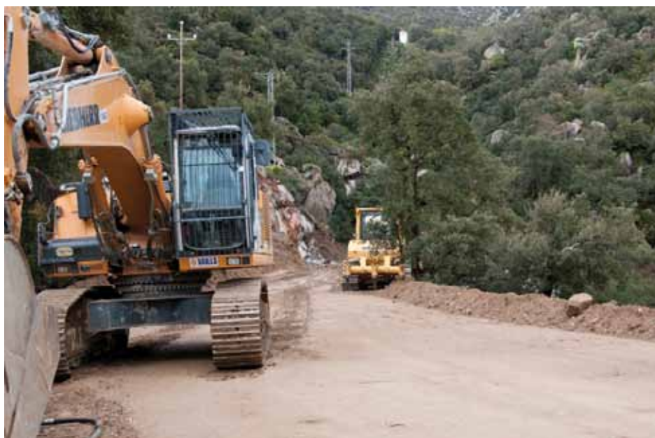
• Màquines treballant en l'ampliació de la pista forestal d'accés a Mas Brugat

reunir tots els permisos. Per part dels impulsors s'ha fet públic que les "pors" apuntades per les alegacions no seran així ja que l'activitat es farà en dues fases diferenciades, s'aplicaran tècniques de restauració integral, es faran regs periòdics a la zona, els camions que transportin material sempre aniran coberts amb lona i no es faran voladures amb explosius els dies que faci vent. El període d'explotació serà de 12 anys i compta amb els permisos de la Delegació de Medi Ambient a Girona, Direcció General de Paisatge i Mines de la Generalitat, Comissió d'Urbanisme de Girona i permís d'obres i llicència ambiental de l'Ajuntament de la Jonquera.