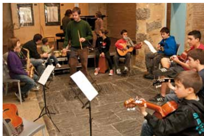
Taller de música de la Setmana Cultural Musical.