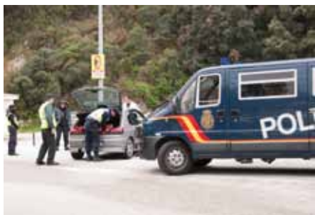
• Control de la policia espanyola al Portús amb motiu de la suspensió temporal del Tractat de Schengen