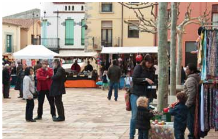
Fira d'Artesania i productes naturals.