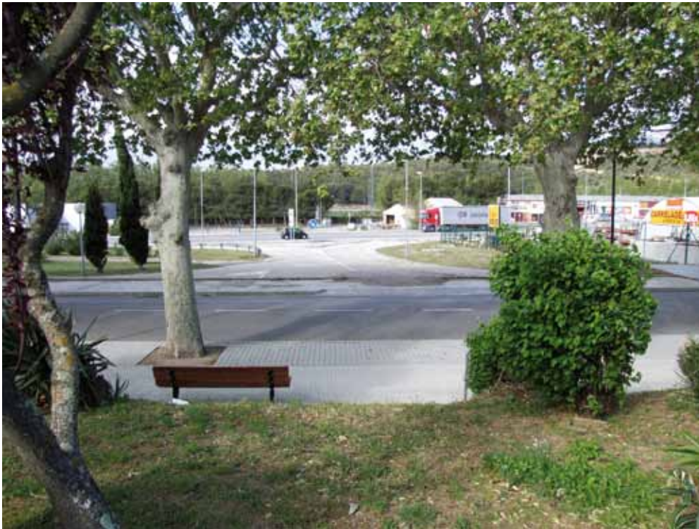
* Imatge del solar on s'ubicaran els mòduls prefabricats de la comissaria de districte dels Mossos d'Esquadra, al costat de l'edifici de la Creu Roja de la Jonquera