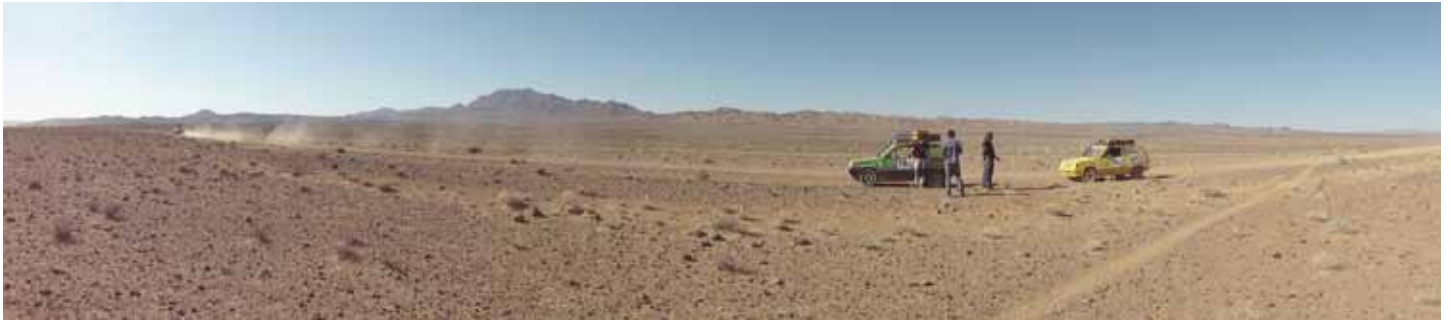
• Camí a Merzouga

havien d'estar unes dues hores arreglant el cotxe: un dia vam trencar el suport del canvi, un altre dia el tub d'escapament i un tub de freno, el ventilador, els amortidors,... i al final vam decidir prendre'ns-ho amb més calma. I dinar tranquils quan podíem, fins i tot, alguna nit anar a dormir a un hotel.