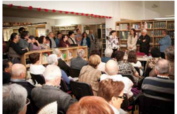
Sessió especial de Conta Contes i actuació del Grup Teiatru dins els actes del XXè Aniversari de la Biblioteca Carles Bosch de la Trinxeria

El dissabte 31 de març la biblioteca Carles Bosch de la Trinxeria va celebrar els seus 20 anys. Per commemorar aquesta data tant especial es va comptar amb un programa d'activitats molt extens, com ara la presentació del llibre "Retalls històrics de la Jonquera".