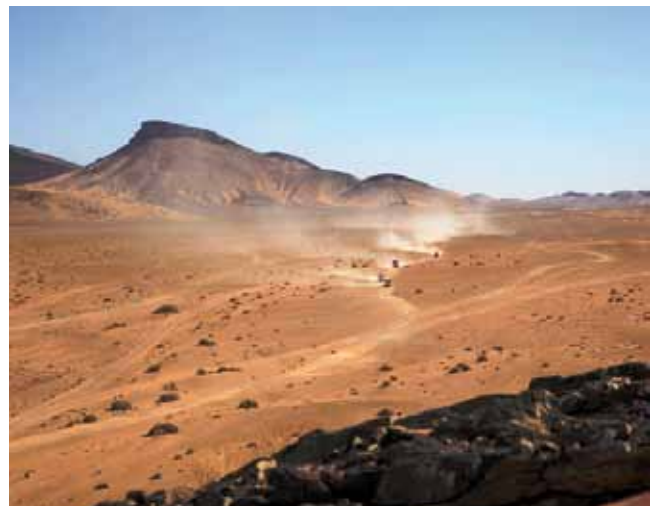
• Camí d'Alnif