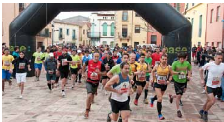
Sortida de la Cursa de La Suada