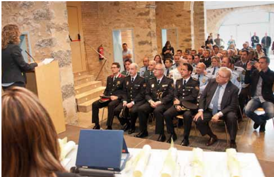
• Els assistents a la celebració de la Festa Patronal de la policia Local, als porxos de Can Laporta.