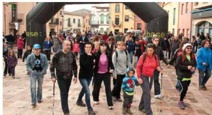
Sortida de la Cursa del Xino-Xano