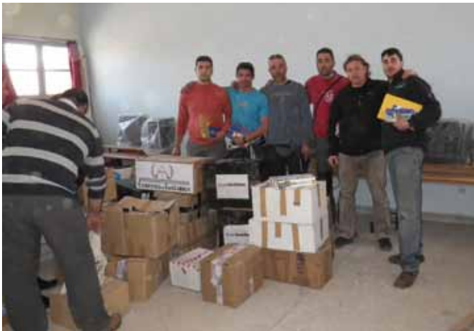
• Aquest és el moment en què es descarregava el material escolar a l'escola de Errachidia. De l'Alt Empordà hi van anar 3 "pandas" i aquests són els participants

Illibretes, bolis, motxilles, pilotes i roba d'esport. Però a més d'aquesta branca solidària, per sobre de tot és un ralli d'aventures per paisatges i terrenys diversos on s'ha de demostrar habilitat conduint i orientant-se. A cavall d'un Seat Panda, és clar.