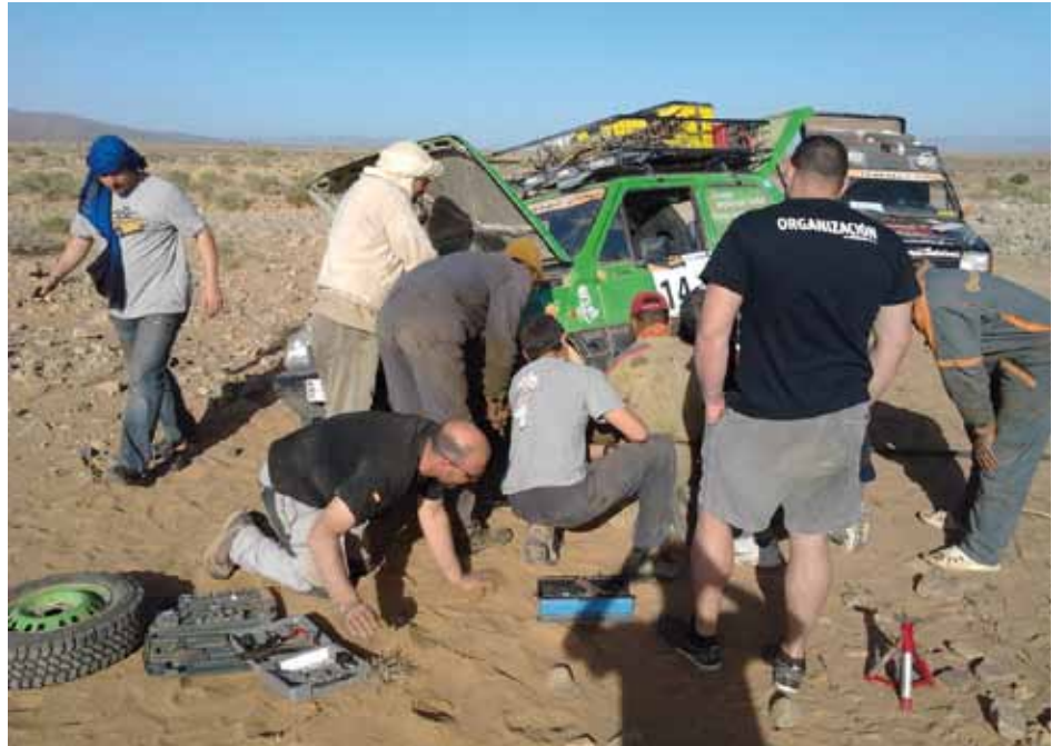
• Reparacions d'urgència en el Panda avariats

BN: Cada nit hi havia gent arreglant els cotxes. Nosaltres ens vam estar un dia màxim fins a les onze, però un dia uns es van quedar fins a les quatre de la matinada canviant el motor sencer d'un dels Pandas. I nosaltres el penúltim dia vam trencar el cotxe en dos, es va partir per baix i va ser fatal. Perquè dels cotxes que solíem anar junts, nosaltres sempre érem els conillets d'índies, sempre anàvem al davant i gas a fondo i si nosaltres passàvem, llavors ja passaven els altres. I en una d'aquestes se'ns va obrir el cotxe i ens vam quedar dues hores i mitja allà tirats. Que me'n recordo que et queia una femella al terra i desapareixia engolida per la sorra.