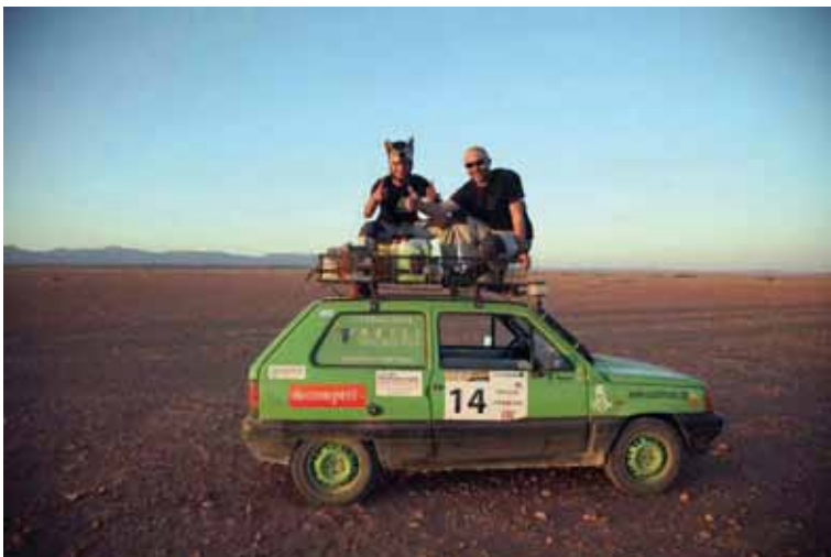
• Els llops del desert

TM: I ja la última etapa que va ser arribant al mar, a Essaouira, que és preciós. I allà l'organització tenia reservat un hotel i vam estar tots allà. I bons tiberis, regatejant el preu del peix a la platja. I l'endemà vam fer una cursa d'una punta a l'altra de platja, i