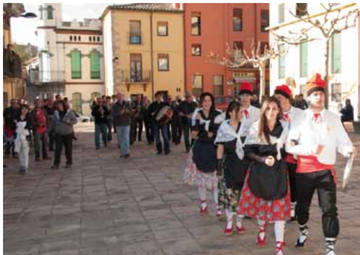
Els Pabordes a la plaça