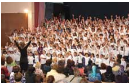
• Cantata especial celebrada a la Jonquera el 2010

Les escoles participants són les d'Agullana, la Vajol, Maçanet de Cabrenys, Biure i Boadella, Espolla, Sant Climent Sescebes, Capmany, Darnius, la Jonquera i el Portús. La posada en comú d'aquest treball fet a cada escola, serà l'11 de maig a les 12 h, en un concert que es farà al teatre de la Societat de la Jonquera, amb la presència de tots els nens i nenes de les escoles participants.