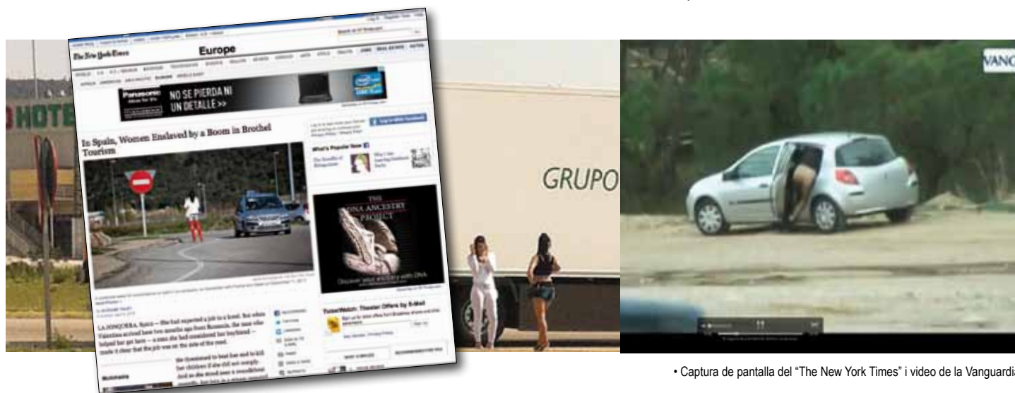
• Captura de pantalla del “The New York Times” i video de la Vanguardia

zona de la duana de la Jonquera. Als pocs dies la notícia va tenir ressó en mitjans de comunicació de l'Estat espanyol però també d'altres llocs del món, com ara Xile. El cas més exemplificant i sensacionalista el va posar el programa d'Antena 3 “Espejo Público”, amb debats i entrevistes en directe, quan en un subtítol de pantalla s'hi apuntava: “La Jonquera, la “meca” de la prostitució” . I el 24 d'abril va ser el torn de La Vanguardia, tot i que amb un to més conciliador: La Jonquera cansada de ser el referent espanyol del turisme sexual . En aquest cas va ser un extens reportatge que també recollia entrevistes i un video “in fraganti”, visita a la zona i entrevistes als veïns de la vila.