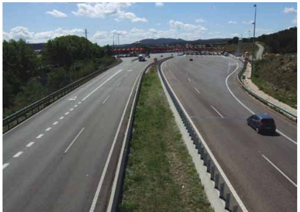
• Peatge de l'AP7, conegut com "barrera" de la frontera, a la Jonquera