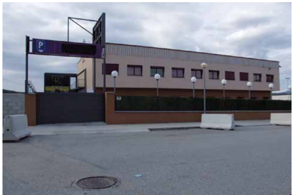
• Façana del Club Privée Paradise, al polígon de Mas Morató