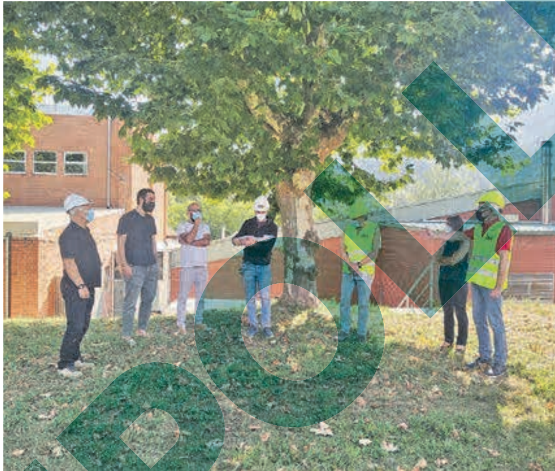
Diverses personalitats van assistir a l'acte simbòlic d'inici d'obres al Municipal de Ripoll