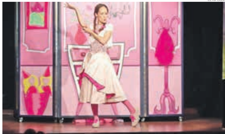
La primera de les propostes: 'Hi ha res més avorrit que ser una princesa rosa?'