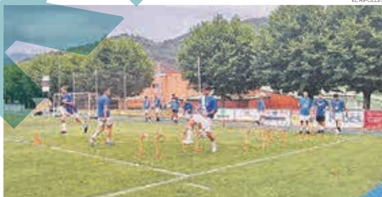
El club inicia pretemporada amb una plantilla de 32 jugadors