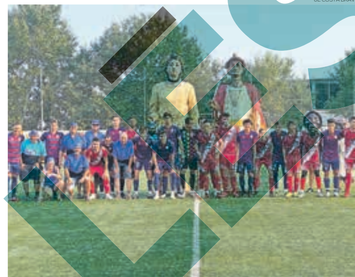
Chaira ja va debutar en l'últim amistós del conjunt de Llagostera