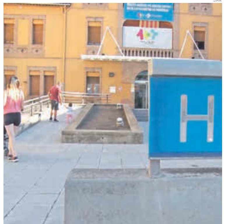
Vista de l'Hospital de Campdevànol

pat perquè la mesura hagi deixat d'existir a la majoria de municipis catalans i ha cridat a la « responsabilitat de tothom », després de la previsió de veure augmentar els contagis arran de les aglomeracions sense mesures en festes com les del barri barceloní de Gràcia. Tot i així, considera el percentatge del 64% de la població amb la pauta de la vacunació completa és una dada molt bona. El conseller veu « molt probable » la sisena onada en les properes setmanes. Ha indicat que la vacuna no evita el contagi però el fa « fins a vuit vegades » més difícil, disminuint-ne les possibilitats d'emmalaltir.