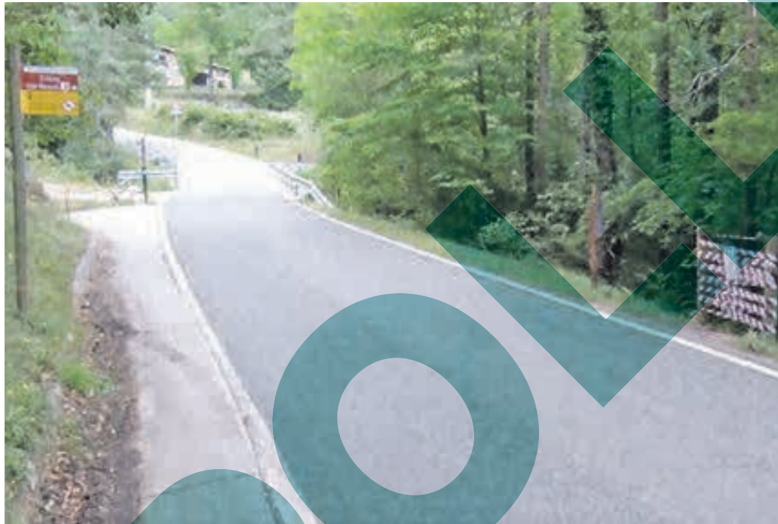
L'accés per poder arribar fins al gorg dels Banyuts de Gombrèn precintat perquè ningú s'hi pugui banyar

L'any passat, l'equip de govern municipal va col·locar uns cartells de prohibició de bany just davant les escales que accedeixen al gorg i actualment encara hi són, però no estan donant el resultat esperat. Per aquest motiu, aquest mes d'agost el consistori s'ha vist obligat a