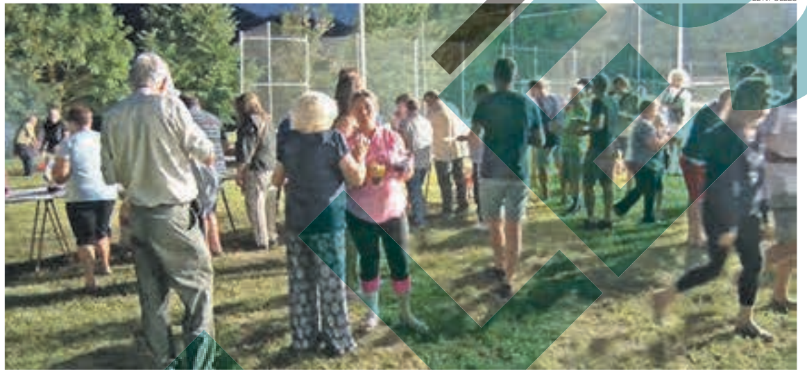
Actes de la celebració al municipi a les darreres edicions