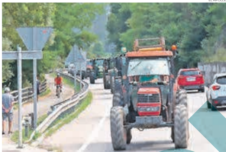
Tractorada pels carrers de Ripoll organitzada per Unió de Pagesos