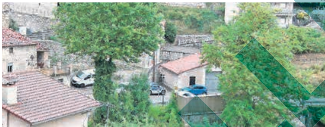
A Gombren les pluges van tornar el 19 d'agost amb fortes ratxes de vent després de quinze dies

El passat dijous a la tarda les pluges van tornar a aparèixer al Ripollès, fins i tot en forma de tempesta i amb fortes ratxes de vent. Això no obstant, no ha fet oblidar la preocupació per la sequera que la comarca havia patit durant els 15 dies previs. Un important exemple de la situació ambivalent que viu la comarca es pot trobar a Gombren. La vila ripollesa era fins la setmana passada el municipi que acumulava més precipitació de tota la demarcació de Girona i, ahora, estava a prop d'assolir el seu mínim històric de pluges en acabar l'agost. Fins ara, el seu mínim s'havia trobat feia pocs anys, quan en tot l'agost només es