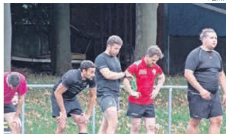
El Ripollès RC seguirà vinculat, d'alguna manera, amb l'Osona RC

Des del club, però, no descarten recuperar l'equip de futbol 11 en un futur pròxim i l'entitat seguirà lluitant perquè així sigui.