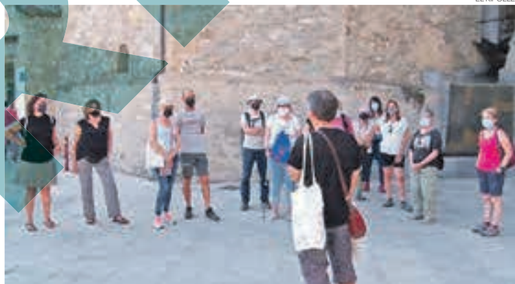
Una de les visites guiades davant el Monestir de Ripoll