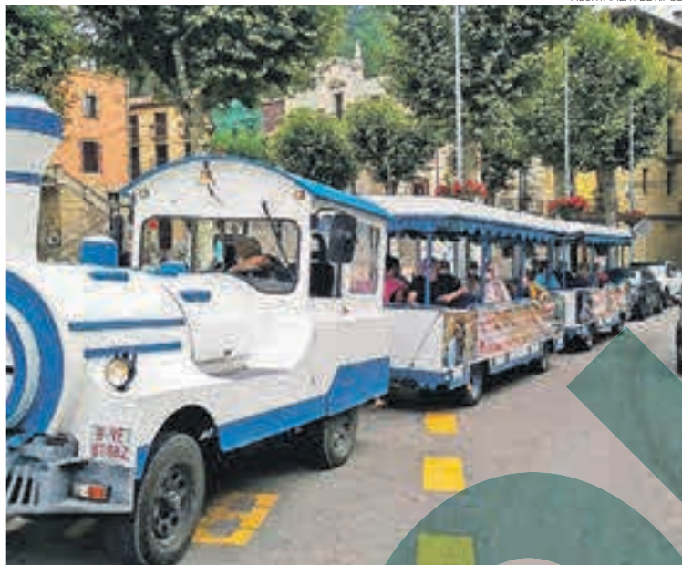
Els usuaris de la residència gaudeixen d'un passeig sobre el trenet

Aquesta mateixa afluència també s'ha vist al trenet turístic, que enguany ha permès adquirir els tiquets per accedir-hi al mateix comboi. En tota, 3.118 persones s'han passejat per la vila amb el trenet, el que suposa un increment d'un 9,5%