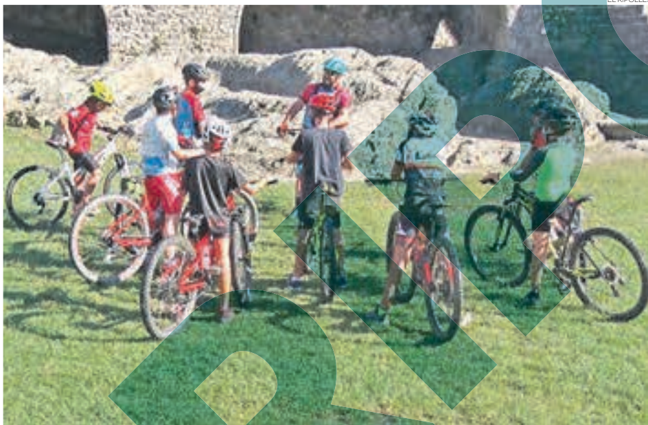
Les sortides de BTT són una de les propostes que es troben a la programació

L'objectiu de l'organització és oferir propostes i eines esportives d'estiu i d'hivern, sense que l'estacionalitat condicioni el festival