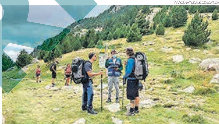
Els informadors rebran un reconeixement per als seus establiments i negocis

Els participants rebran un diploma a l'haver finalitzat el