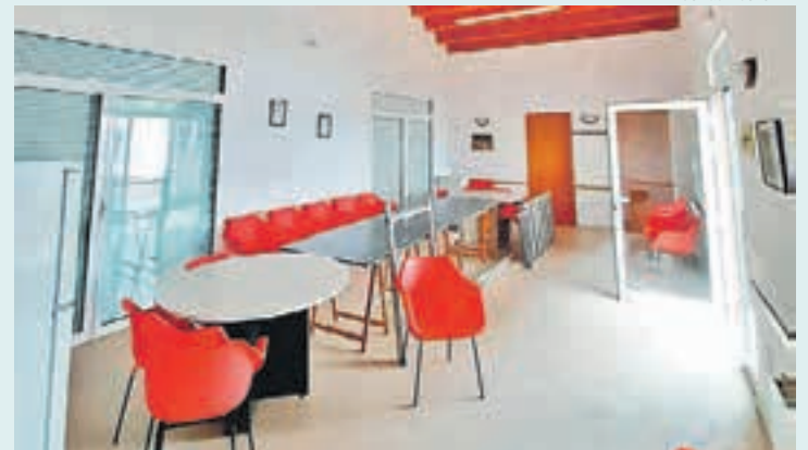
Estat de l'interior d'un dels locals després de la seva millora