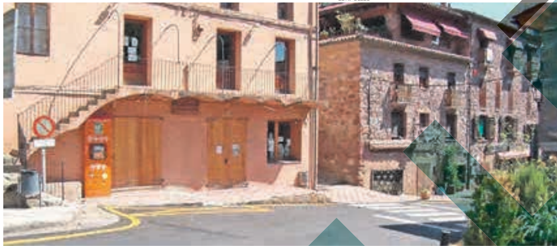
Alguns dels equipaments i comerços del municipi es troben tancats

El grup de ciutadans que ha posat en marxa la proposta creu que el poble actualment ofereix una imatge decadent, ja que molts dels equipaments o comerços es troben tancats, sobretot entre setma-