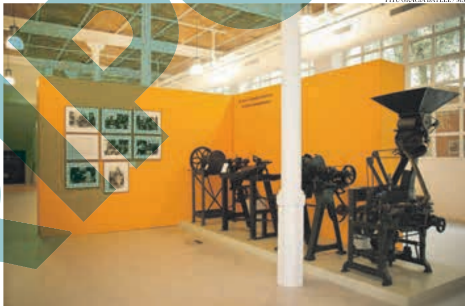
PITU GRACIA BATLLE / MSP

El Museu del Suro s'ubica en una antiga fàbrica surera, la més important del sector industrial a Espanya. Compta, a més d'un passat rellevant dins el sector, amb uns elements poc comuns a les construccions sureres que, sovint, són edificis funcionals sense concessions als elements decoratius ni a la participació d'arquitectes reconeguts. Aquest aspecte fa encara més rellevant el conjunt en què destaquen els elements modernistes, les dimensions i l'estructura. L'edifici que acull l'actual museu va ser construït l'any 1899-1900 on s'hi ubicava l'empresa Miquel, Vincke & Meyer fundada el 1900 per Joan Miquel Avel·lí, Heinrich Vincke Wischmeyer i Pau Meyer Unmack. En destaca la decoració