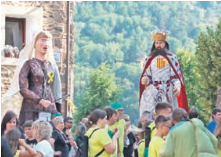
Trobada gegantera de l'any 2019 a Vallfogona durant la Festa Major