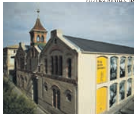
PITU GRACIA BATLLE / MSP