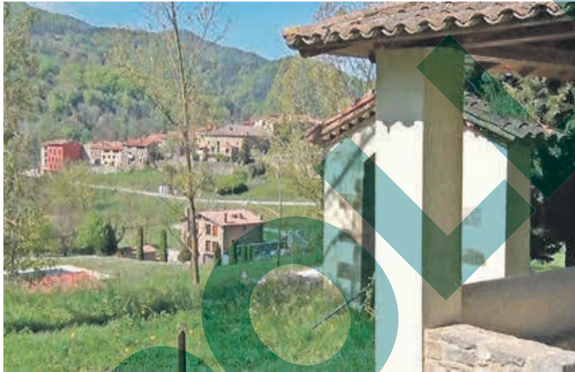
Vallfogona de Ripollès s'ha fixat en el col·lectiu dels sanitaris des del relliquer que inspira el premi La mirada oberta

Auest agost, la trobada era considerada « de transició », després d'un any d'obligada cancel·lació del premi i, en comptes d'una personalitat, s'ha pensat en un ampli col·lectiu que abarca molts dels professionals que