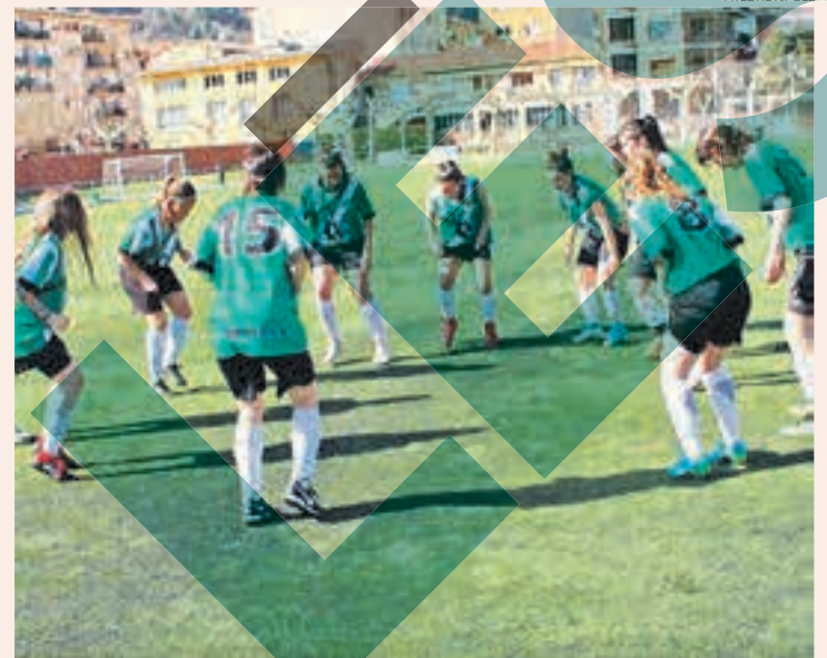
El club confia en poder recuperar el futbol 11 en un futur

L'Atlètic Ripoll no farà sènior de F-11 el curs que ve