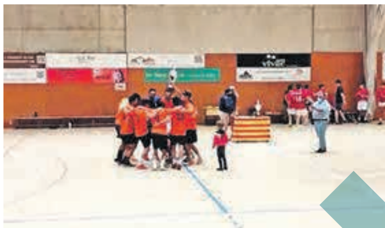
La final es va disputar divendres passat al pavelló Llandrius de Camprodon

Camprodon va cloure vint dies de futbol sala. L'equip Carnisseria Colom es va proclamar guanyador de la 40a edició del Torneig de Futbol Sala celebrat aquest estiu al municipi. El conjunt es va imposar en la categoria principal de la competició, la C, reservada per als jugadors nascuts a partir del 2005. En una edició encara marcada per les restriccions derivades de la pandèmia de la COVID-19, un bon grapat d'espectadors van poder gaudir durant aquest mes d'agost dels partits celebrats al pavelló Llandrius. El divendres passat no va ser menys i el recinte es va omplir per la final de la categoria principal.