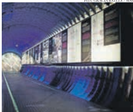
PITU GRACIA BATLLE / MSP