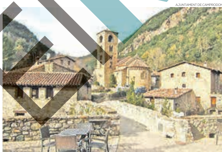
AJUNTAMENT DE CAMPRONDON

Finalment, el batlle de Camprodon ha assegurat que l'acreditació i ingrés de Beget a l'associació també garantirà l'ajuda per seguir millorant i mantenir-se a dalt de l'esca-