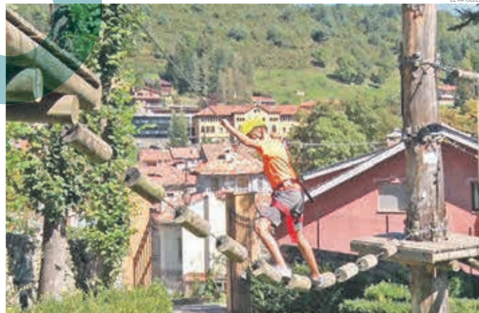
Per als més petits hi haurà activitats com els ponts penjants