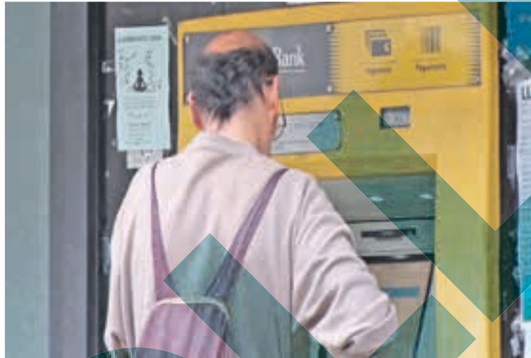
Llanars vol mantenir el seu caixer obsolet i reubicar-lo davant la sala de ball

El descens de punts d'efectiu és el producte de la digitalització. Les entitats financeres veuen cada cop menys negoci en pobles petits on la realitat i l'edat de molts veïns no coincideix amb les grans poblacions. Les viles que han perdut el caixer o mai no l'han tingut, encara creuen que seria beneficiós per als veïns, mentre que les que encara mantenen el servei han de lluitar per seguir-lo oferint, malgrat sigui utilitzat tant pels veïns del propi municipi com pels dels voltants. És el cas de Llanars, on el caixer, que està antiquat però que es troba en un sector amb bon aparcament,