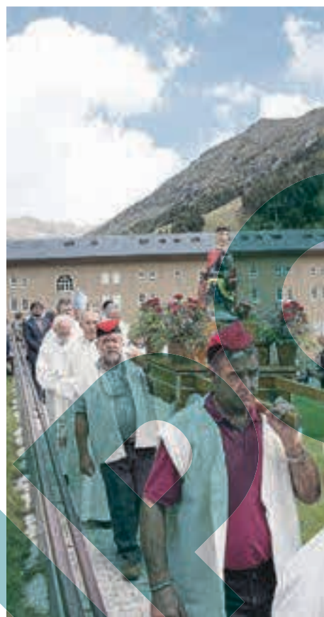
Una de les activitats de la diada de Sant Gil