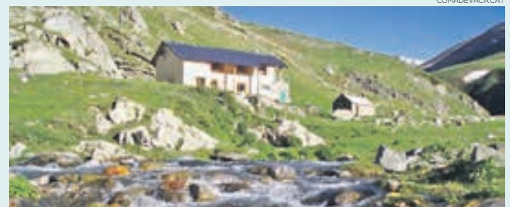
El refugi de Coma de Vaca, un dels participants a la iniciativa