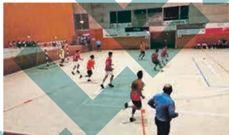
Tot i les restriccions per la pandèmia hi va haver gran afluència de públic

la categoria B, el triomf va ser per al Pont 9 Collboni Les Planes. En dones, les millors de la competició van ser P3 Disco, mentre que en la categoria de Veterans, el triomf se'l va