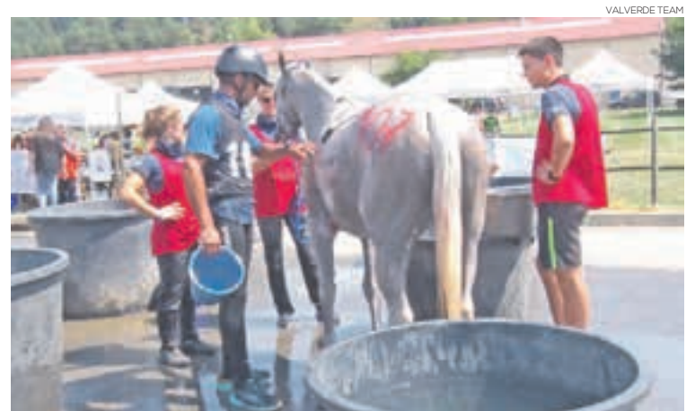
La calor també va ser present en la jornada equestre

convertit en un clàssic de muntanya i això el fa un circuit més tècnic amb una dificultat més elevada i on la velocitat dels cavalls no és tant alta. És per això que aconseguir creuar la línia d'arribada ja és tot