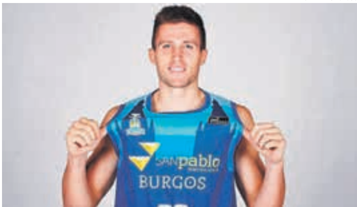
SAN PABLO BURGOS

El pròxim partit de pretemporada el tindran aquest divendres 27 d'agost