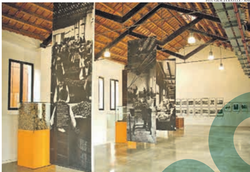
PITU GRACIA BATLLE / MSP