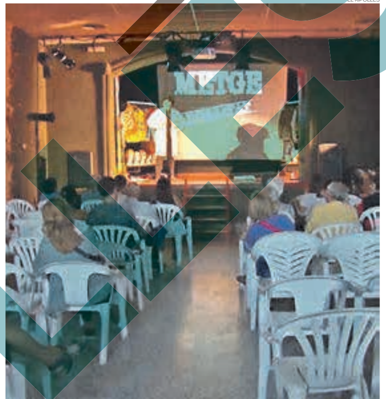
'El comediant' va cloure el cicle del Campelles Emociona

Mir, va presentar 'Hi ha res més avorrit que ser una princesa rosa?', que de la mateixa manera que l'espectacle que ha posat el punt i final al cicle, 'El comediant', també va obtenir una bona rebuda per part del públic. La segona obra va ser 'Contes del món de les germanes baldufa', de Tana-ka Teatre, també representada al teatre de la vila.