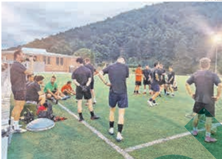
De moment estan treballant en recuperar el ritme físic