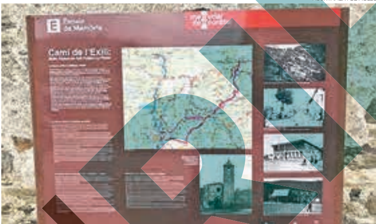
El poble s'ha adherit a la Xarxa d'Espais de Memòria Democràtica de Catalunya