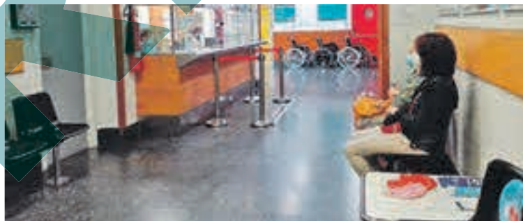
Dues pacients esperen a ser ateses a la recepció de l'Hospital de Campdevànol

Aquest dimecres l'Hospital Comarcal de Campdevànol acollia un únic ingressat per COVID-19 a les seves instal·lacions. La setmana anterior, va complir amenys set dies sense ingressos i 15 sense derivacions a un altre centre per reforçar-ne la ventilació. Des de l'1 d'agost, els casos confirmats per coronavirus al Ripollès han baixat de 86 a 15, i en tot aquest temps el pas per l'hospital ha estat escàs. Els darrers ingressats per COVID-19 havien tingut generalment un pronòstic lleu i van obtenir l'alta abans d'una setmana. Alguns d'ells ni tan sols eren veïns del Ripollès, sinó visitants d'altres comarques, com ha ex-