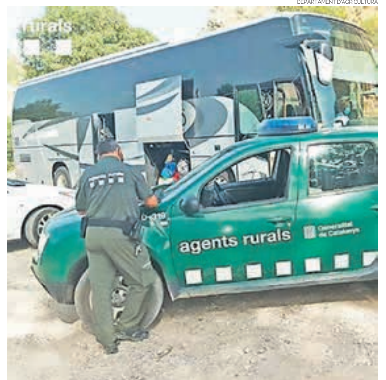
Un dels controls que va efectuar el cos dels agents rurals

Encara que les temperatures ja no són tan altes com les de la setmana passada, des del govern es demana no abaixar la guàrdia perquè encara hi ha risc d'incendi en algunes zones.