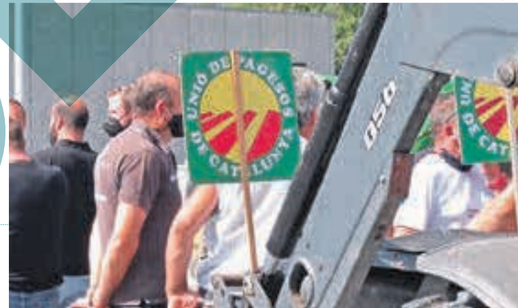
El sindicat aplega una cinquantena d'assistents

Aquest dimecres estava prevista una reunió entre les parts afectades, de la qual de moment no n'havia transcendit cap informació al tancament d'aquest setmanari. La qüestió ha comportat el posicionament de particulars, entitats i col·lectius diversos, com les associacions de propietaris de la Vall de Camprodon i de l'Alta Garrotxa. «L'àrea de medi ambient de la Generalitat manté de fa anys una actitud hostil, prepotent i d'assetjament envers tot allò que té a veure amb la pagesia i agricultura» , exposen en un escrit.