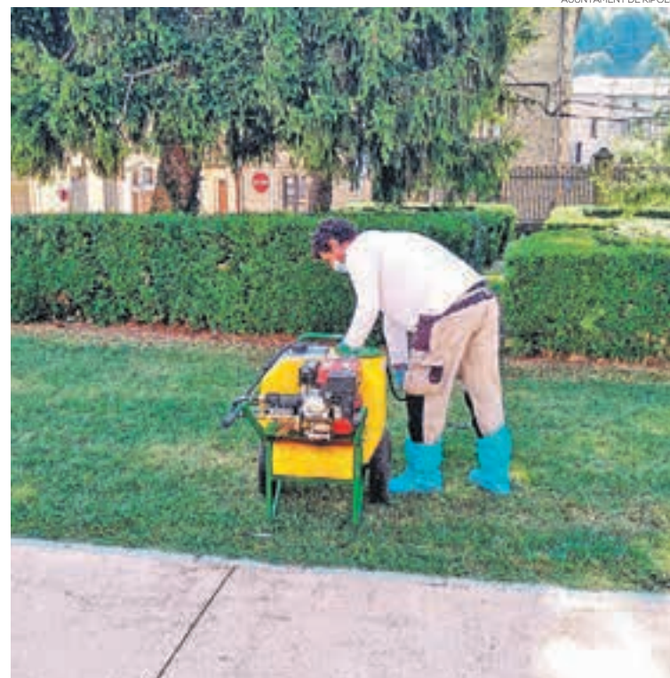
Un operari aplica el tractament contra l'eruga del boix a l'entorn del Monestir de Ripoll

Tot i la menor incidència detectada aquest estiu, la plaga ha seguit expandint-se a Catalunya. A principis d'any, va arribar per primera vegada al Priorat, el Baix Ebre i el Baix Penedès. La Garrotxa continua sent la comarca més afectada.