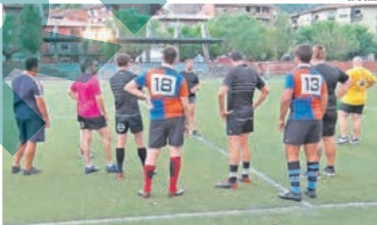
Estan centrats en consolidar un bon equip sènior