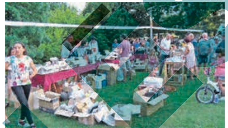
L'esdeveniment oferirà activitats, parades i concerts