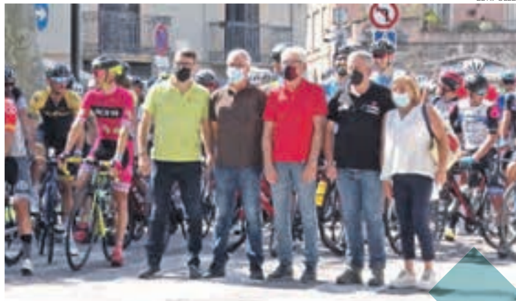
L'organització va esgotar les 200 inscripcions que hi havia disponibles

A les quatre de la tarda es donava el tret de sortida a la cursa des de la Plaça de l'Ajuntament de Ripoll. El recorregut constava de 50 quilòmetres i travessava diferents municipis de la comarca per acabar en un dels ports ciclistes més exigents del territori i escenari de l'última edició de La Volta, Vallter 2000. La pandèmia va