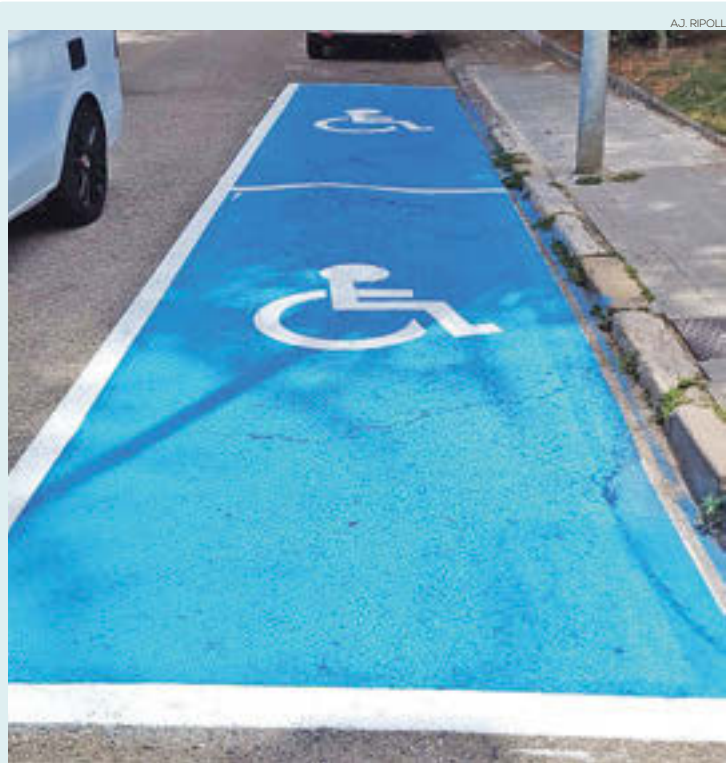
Una de les intervencions

Els treballs han tingut un cost de 6.050 €, dels quals 3.825,00 han estat subvencionats per la Diputació de Girona. La resta s'ha sufragat des de fons propis de l'ajuntament, que no ha establert taxes pel servei.