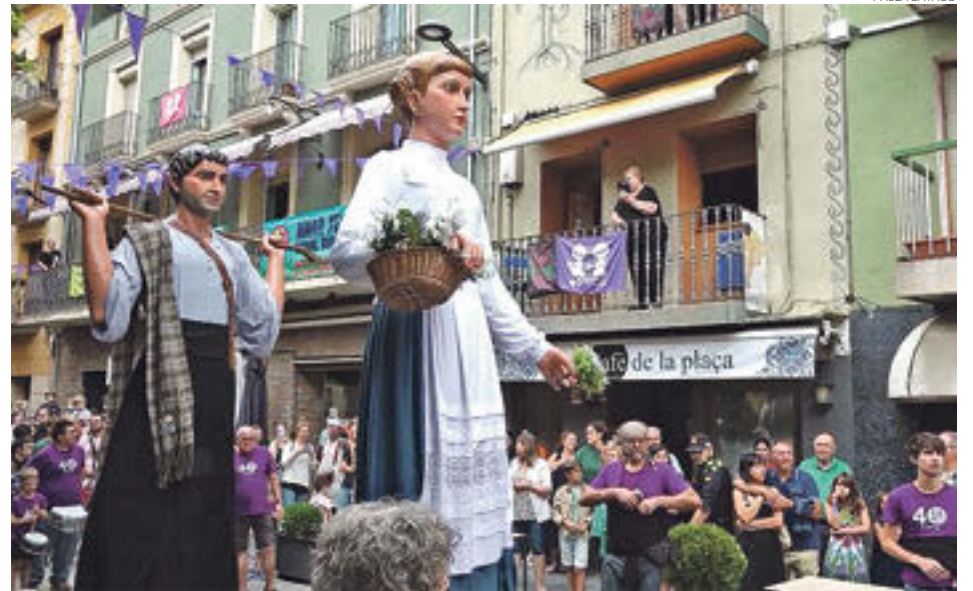
Els Gegants, protagonistes de la Festa Major de Ribes