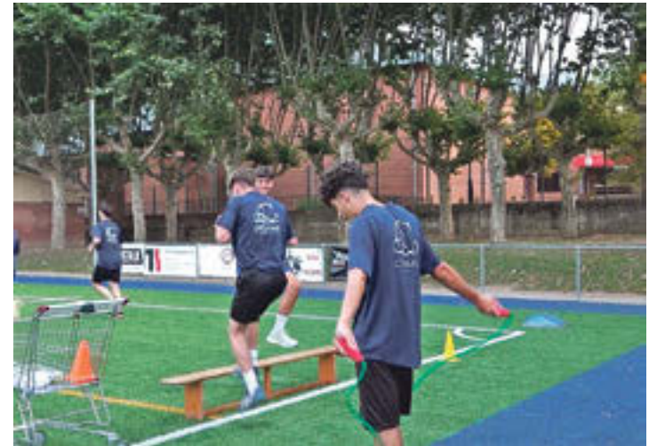
Entrenament del CF Ripoll