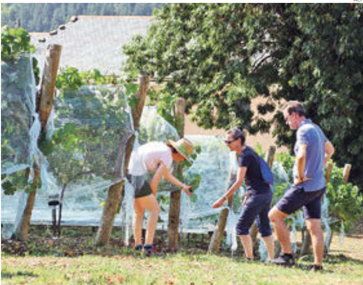
Moments de treball a les vinyes

Maria Martí marida bé amb carns blanques, formatges o sushi. La família es mostra molt orgullosa del vi que han aconseguit. Tot i que insisteixen que cal anar «pas a pas», i comprovar que el vi «agrada» i se situa bé en botigues d'alimentació i restaurants, tampoc amaguen la intenció que en un futur el projecte segueixi creixent al territori.