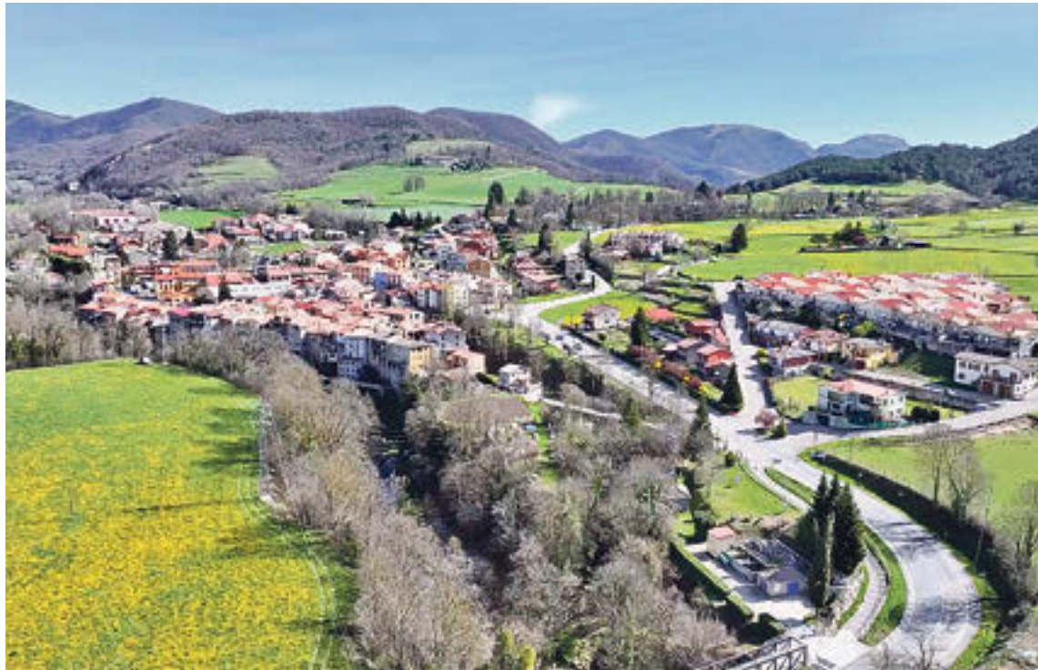
Sant Pau de Segúries treballa per millorar la seguretat viària a la vila

L'alcalde, Albert Coma, detalla: «Els vehicles han de passar a unes velocitats raonables, no pot ser que superin les que marca la llei». A partir d'aquí, algunes de les propostes que s'han redactat en aquest pla són «la instal·lació d'un radar de velocitat, pintar el paviment per delimitar la velocitat a la