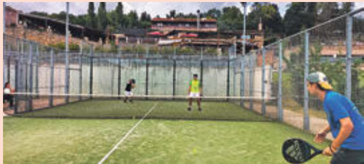
Dues parelles disputant el torneig a les pistes de l'Hotel Mític