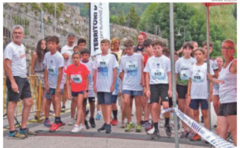
Sortida de la distància més llarga

Es tracta d'una proposta adreçada pels més petits que compta amb tres distàncies adaptades en funció de l'edat. Aquí, però, els carrers de la vila són els protagonistes i familiars i amics es reuneixen a cada cantonada per a donar escalf als més petits i per a deixar retratat l'instant. Alguns, fins i tot, s'atreveixen a calçar-se les vambes i els acompanyen durant el traçat. El recorregut és totalment urbà i es divideix en distàncies d'1 quilòmetre, 1,5 o 3 quilòmetres en funció de l'edat. Tot i això, des de l'organització volen realçar la participació més enllà de la posició. «Més que els premis intentem fomentar que la gent vingui, corri i participi» .