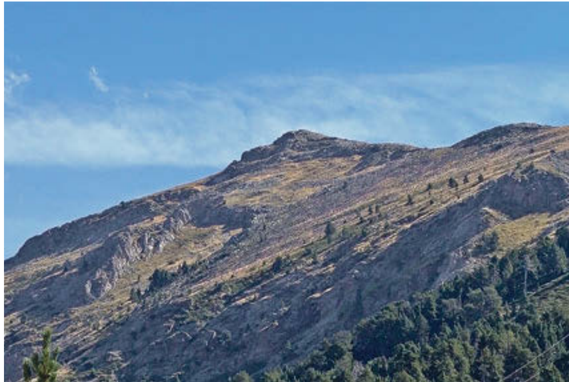
Alta muntanya al Ripollès

Els rescats de persones accidentades a la muntanya són els més recurrents. En tot el 2023 se'n van fer 1229. Enguany, fins al 6 d'agost, se n'han fet 686. Si comptem només els mesos de juny a setembre, l'any passat se'n van fer 494; enguany, fins al passat dia 6, 249. Les recerques són el segon gran servei en l'àmbit del salvament de persones