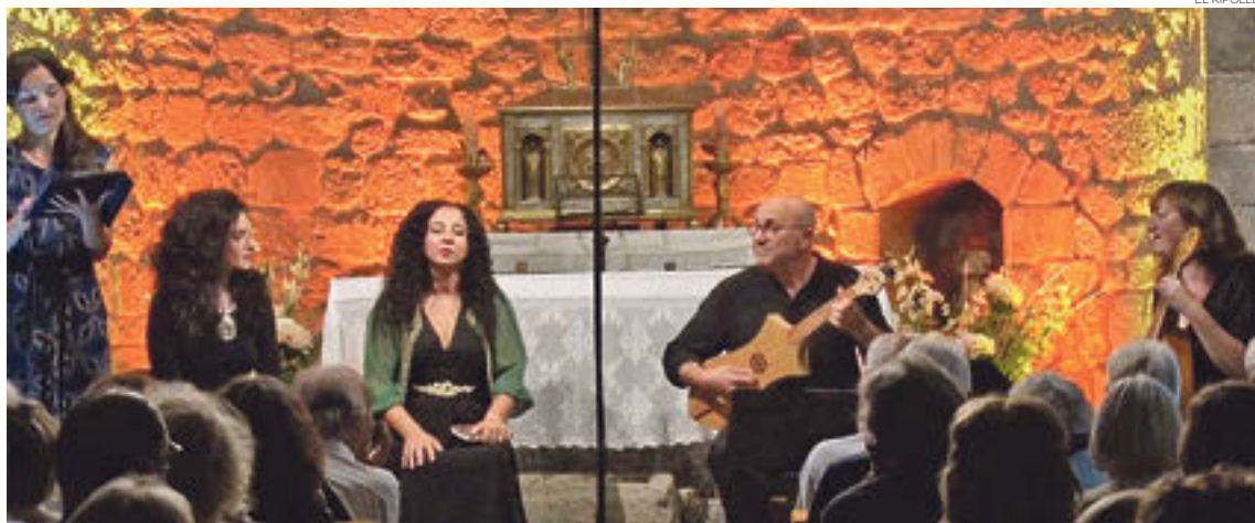
Concert del FeMAP a Llanars

fascinant, mogut i sense deixar de ser música antiga»,