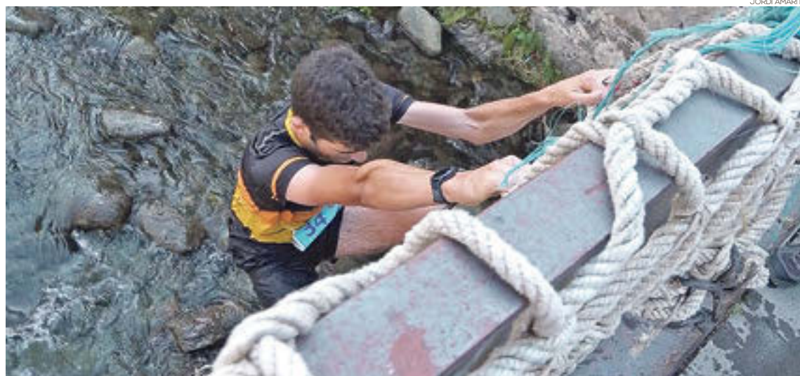
L'ascens al pont de la plaça és una de les proves més tradicionals

Remullada pel riu, pujada al cementiri, travessar els obstacles dels inflables del passeig o el tradicional ascens al pont per la xarxa. Ribes de Freser s'ha immers en una nova edició de l'Anar Fent Rural Running, la cursa per excel·lència dels Bombers Voluntaris de Ribes i que s'emmarca dins dels actes de festa major. Una prova d'obstacles que any rere any reuneix a un bon grapat de participants i que enguany ha aglutinat a 244 corredors i corredores en la distància llarga i una seixantena d'infants en la curta. Des d'un bon principi ja es marquen diferències en la primera pujada a Ventaïola. «És un desnivell important per a començar a descar-