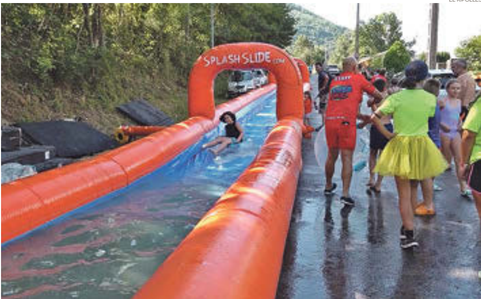
Tobogan gegant al passeig Taga

Al vespre es va fer la cloenda de festa major, amb el tradicional castell de focs i una sessió de cinema a la fresca que ha tancat una de les festes més completes a tot el Ripollès.