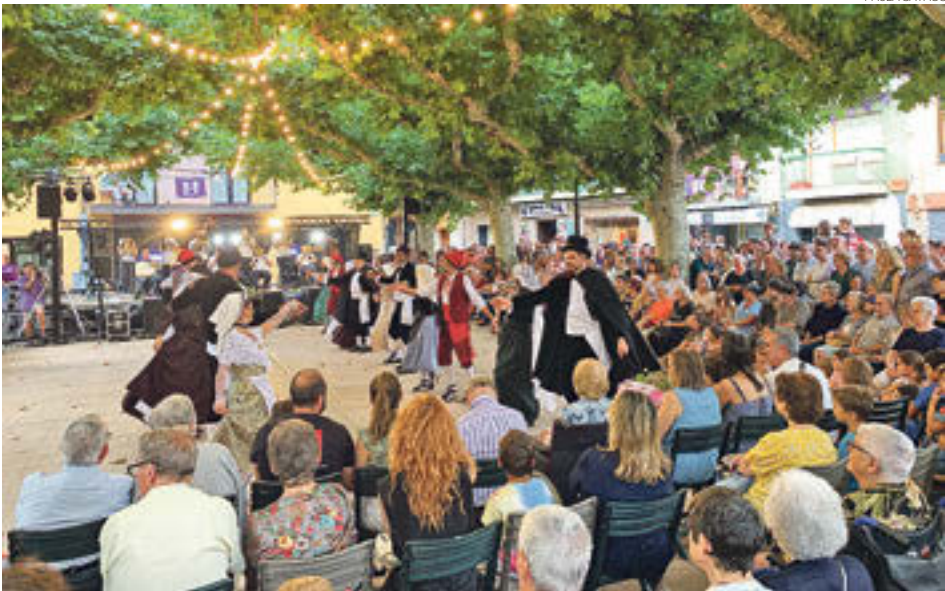
El Ballet de Déu

LA VILA HA PASSAT UNA SETMANA DE FESTA MAJOR PLENA D'ACTIVITATS, PER A PÚBLICS DE TOTES LES EDATS I TOTS ELS GUSTOS, MESCLANT TRADICIÓ I MODERNITAT