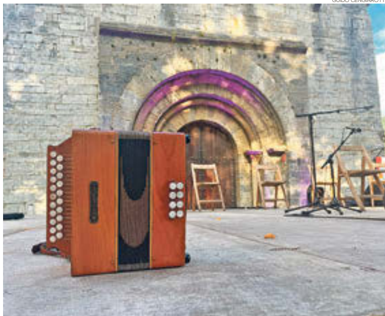
L'acordió diatònic, protagonista a la trobada