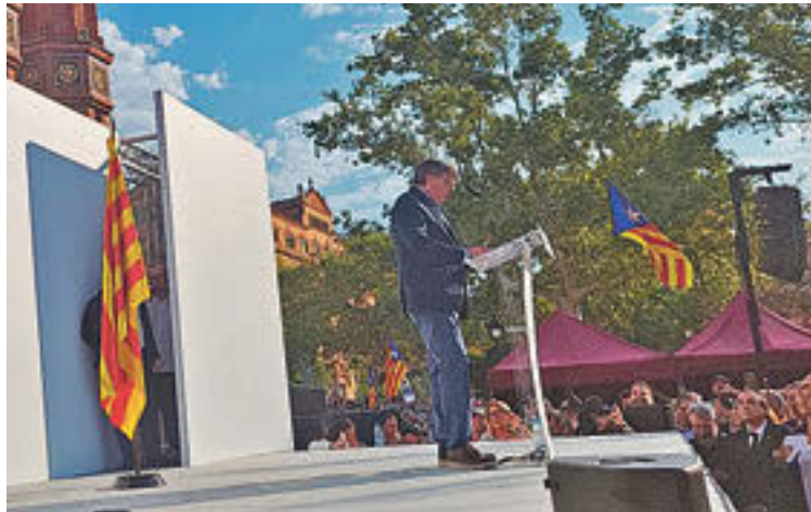
Imatge del parlament de Carles Puigdemont