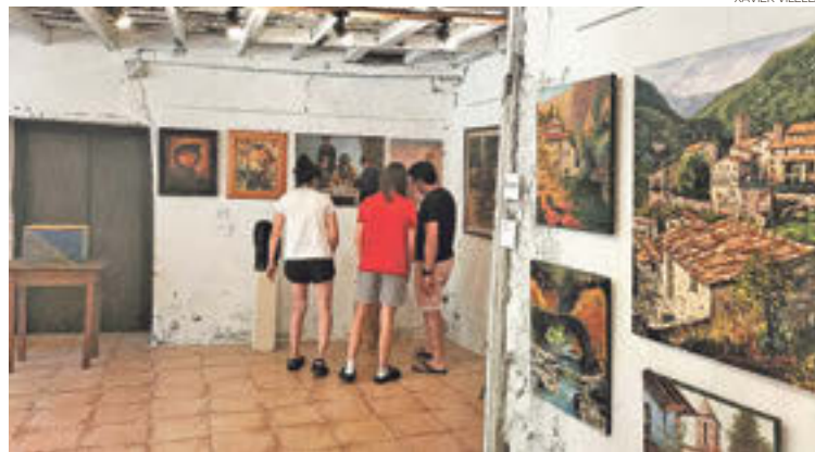
Algunes obres de pintura contenen referències a la comarca

Des de principis d'agost, Beget acull a la rectoria la primera mostra d'artistes locals, organitzada per l'associació de veïns del municipi. L'exposició, que estarà oberta al públic fins aquest diumenge, consta d'obres de diferents disciplines: treballs fets en pintura, escultura en pedra i fusta, ceràmica, dibuix, o arts audiovisuals. Aquesta iniciativa representa l'essència d'un poble com Beget, amb la solidaritat i col·laboració entre veïns com a element transcendental. «Tot-hom ens va respondre molt generosament. Ens va agradar molt el fet de tenir l'opor-