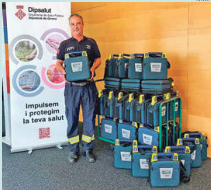
Els aparells formen part del programa 'Girona, territori cardioprotegit'