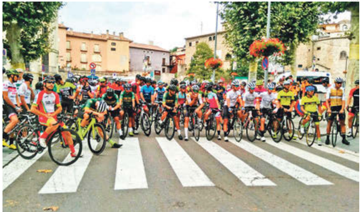
La sortida es farà des de la plaça de l'Ajuntament de Ripoll

Hi haurà diverses categories participants des de Júnior, Sub-23, Elit, Màster, Màster 30, Màster 40, Màster 50 i Màster 60, tant de categoria masculina com femenina.