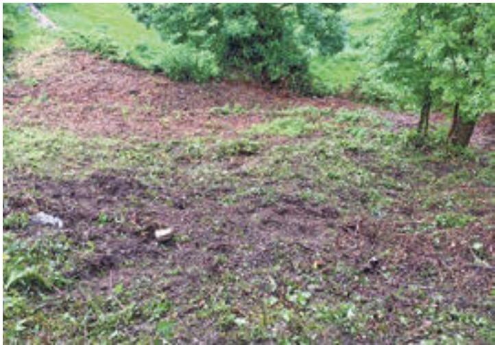
Les franges de Molló