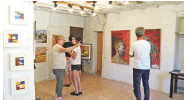
Hi ha hagut un degoteig constant de persones que s'han interessat per visitar la mostra