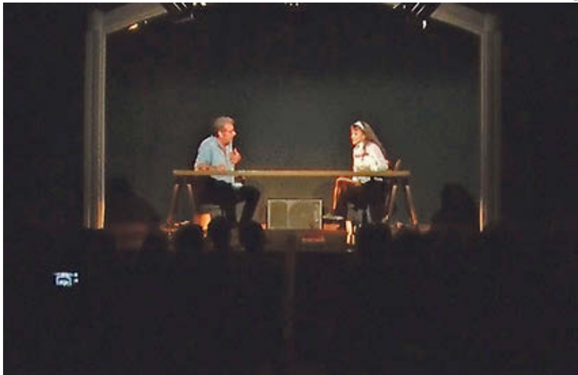
Moment de la representació, en una sala del Teatre de Campelles que va quedar petita

«El xoc entre dues maneres molt diferents de veure el món. Pla era un home que tenia 74 anys, era conservador, monàrquic, i, en canvi, la Montserrat Roig en tenia 24, tenia un fill, havia militat al