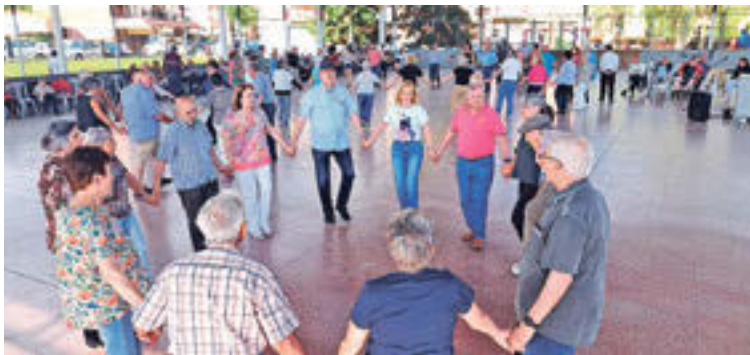
AGUPACIÓ SARDANISTA RPOLL

DIVERSOS MUNICIPIS PROPOSEN ACTIVITATS AMB LA DANSA CATALANA