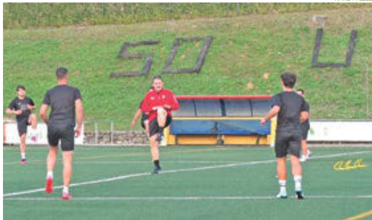
Primer entrenament de la UE Camprodon