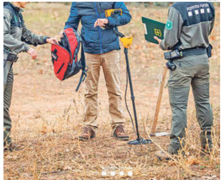
Agents rurals intervenint en l'ús il·lícit de detectors de metall

Els Agents Rurals també vetllen per la conservació del patrimoni arqueològic i paleontològic, vulnerable a l'acció humana, especialment quan és il·lícita.