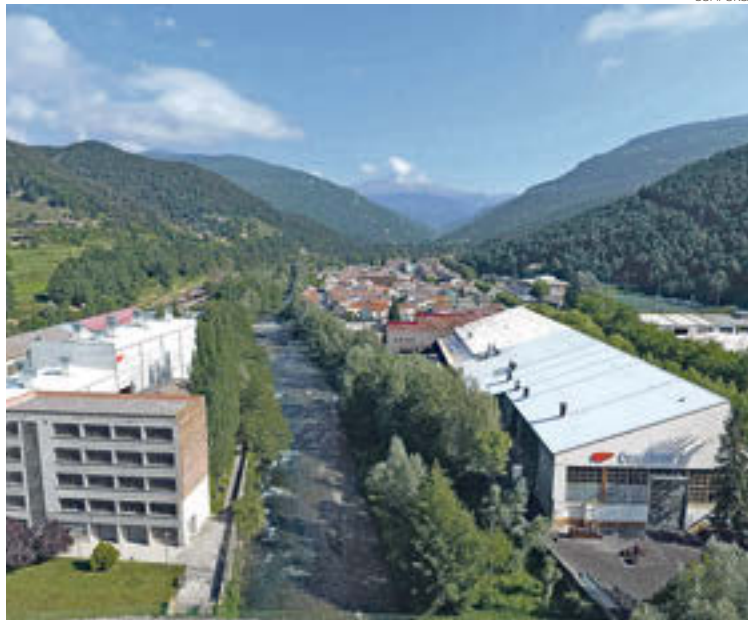
Una de les factories de Comforsa

La companyia, que pertany al 100% a Avançsa, el hòlding públic del Govern, va registrar uns ingressos de 73,3 milions d'euros, en comparació amb els 84,4 milions de 2022. Aquesta disminució dels ingressos inclou també la venda de ferralla, un mercat en el qual Comforsa opera de manera paral·lela a la seva activitat principal.