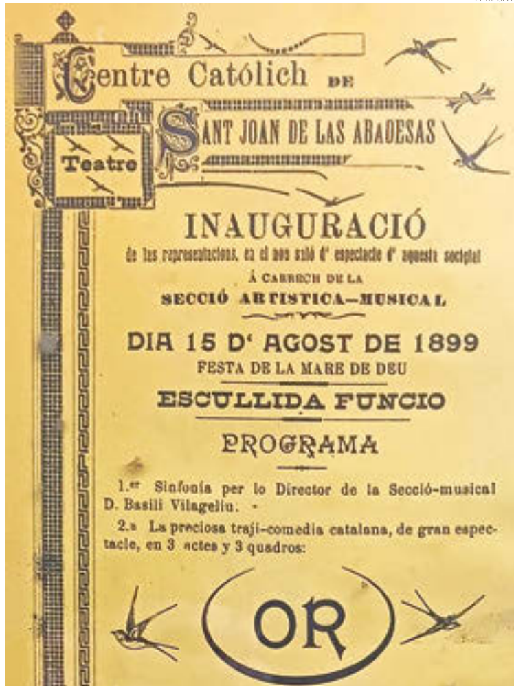
El SAT Teatre Centre, històric edifici i entitat de la comarca

També s'hi indiquen els detalls de la sarsuela, que, diuen, és «chistosa i molt divertida».