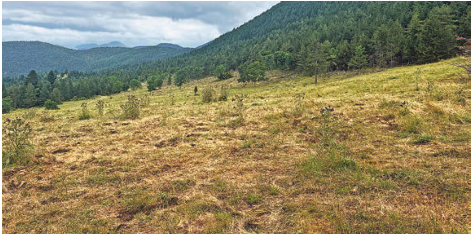
Les noves pastures dels Plans de Querol de Toses, una zona on s'ha actuat

Entre les espècies que es preserven amb aquests espais oberts hi ha ocells com la verderola i el bitxac rogenç o rèptils com el llargardaix pirinenc, endèmic del Ripollès i la Cerdanya. Des del consorci, a banda de promoure aquestes actuacions des de subvencions, també es fa un seguiment per controlar la qualitat dels espais des d'una metodologia que s'ha ideat al Parc Natural de les Capçaleres del Ter i del Freser. Des del recorregut per alguns transsectes, es comptabilitza la presència de plan-