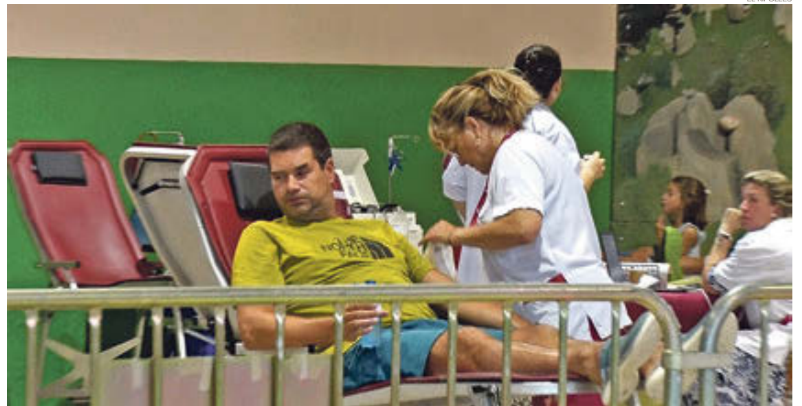
La campanya de donació de sang de Camprodon ha rebut una resposta satisfactòria per part de la població

L'acapte celebrat a Camprodon ha rebut més donacions per part de gent de fora que no pas del municipi