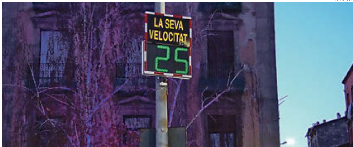
El radar educatiu té per objectiu dissuadir els conductors que circulen amb excés de velocitat

El cap del cos a la capital, Francesc Campayo, concreta que «la gent va més a poc a poc des que nosaltres posem