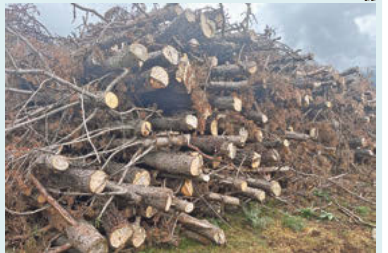
Les piles de fusta es deixen assecat perquè sigui aprofitable per a biomassa

Les actuacions són relativament cares i el cost que tenen per a l'administració té molt a veure amb les facilitats per a l'empresa de fusta d'extreure el material. Tot i això, han anat desapareixent empreses perquè l'activitat silvícola és cada dia menys rendible. Però Baena apunta que «sembla que hi ha una tendència, gradual i petita, però una tendència, a veure el bosc com un espai d'on treure recursos, com abans».