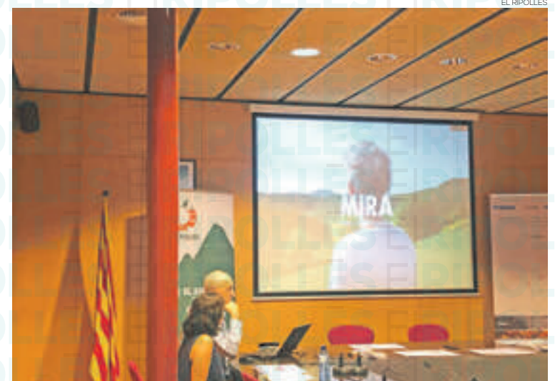
Vídeo de presentació del projecte Vora Ter