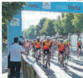
CAMPRODON | R.S.

No hi haurà segona edició de la Ciclovolta. Els responsables de la Volta Ciclista de Catalunya han hagut de cancel·lar la prova d'aquest 2022 per la falta de participants. L'esdeveniment, que va néixer per commemorar el centenari de la Volta, s'havia de celebrar el diumenge 10 de juliol a Camprodon, però al final no serà així a causa del baix nombre d'inscrits. L'any passat més de 500 corredors hi van formar part, però l'increment de curses d'enguany i la baixa participació ha obligat els responsables a suspendre-la.