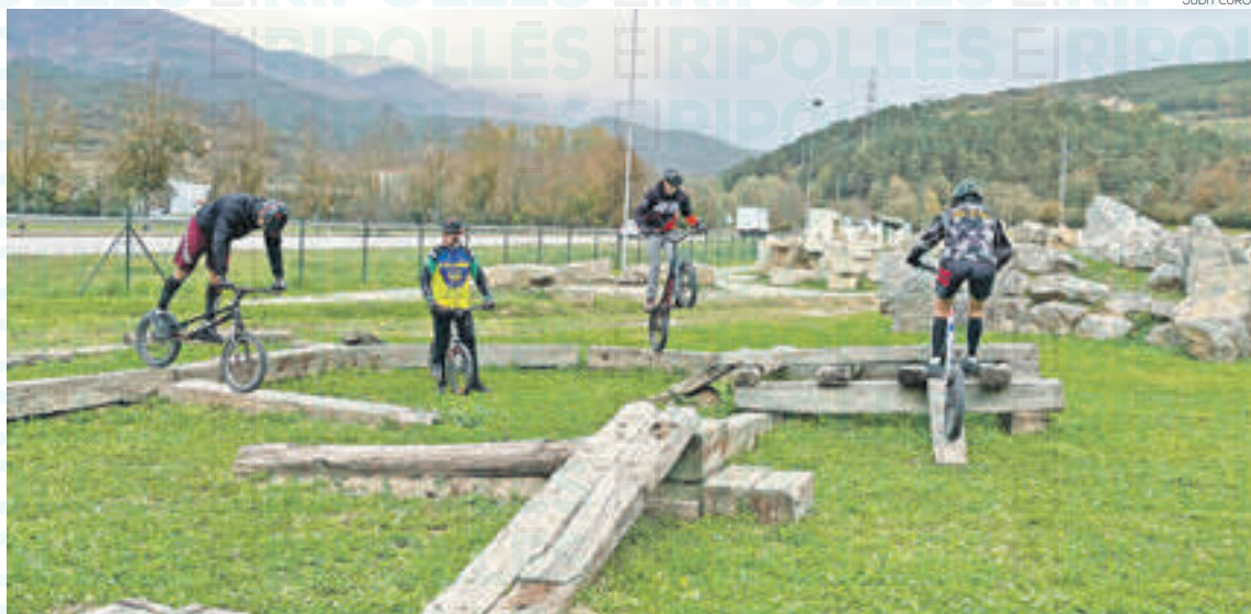
Alumnes del curs 2021-2022 entrenant a les instal·lacions de l'Avellaneda

Amb el curs ja finalitzat, el centre ja treballa per encarar la pròxima temporada. De mo-