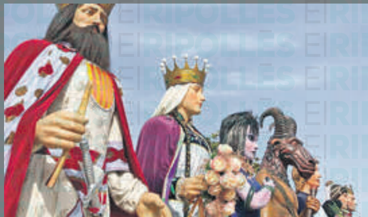
Els gegants de Ripoll als Hostalets de Balenyà