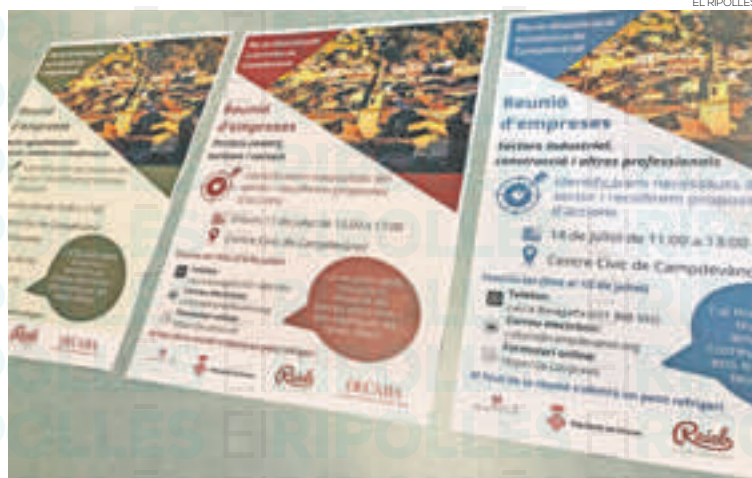
Reunions convocades amb els responsables de les empreses de la vila

L'Ajuntament de Campdevàrol ha rebut una subvenció de la Diputació de Girona per a traçar un pla sectorial de desenvolupament econòmic que es durà a terme gràcies a la participació de Raiels i Decaba, empreses especialitzades en l'elaboració d'estudis d'aquesta tipologia. L'objectiu és trobar solucions a les possibles problemàtiques que es recullin dels diversos sectors empresarials, des de l'agrari, el comerç, turisme i serveis i l'industrial. En definitiva, es tracta de tenir una radiografia de la situació de tots aquests diversos sectors econòmics del municipi per saber quin és el seu estat i les futures accions a emprendre perquè tinguin una evolució i un creixement. A més,