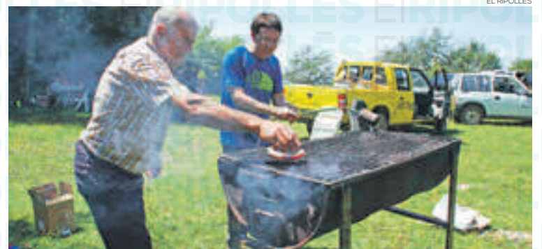
No hi faltará el dinar popular per fer germanor

i tot seguit el dinar de germanor. En cas que faci mal temps l'organització ja ha previst fer el dinar al poble. Amb un preu de 12 euros els adults i 8 euros els nens, es podrà fruit d'un bon menú el qual constarà de: meló amb pernil, llangonisseta i cansalada viada, postres, pa, vi i cava. Tot plegat com a excusa per a viure una jornada de germanor i retrobament després d'aquests dos anys de pandèmia.