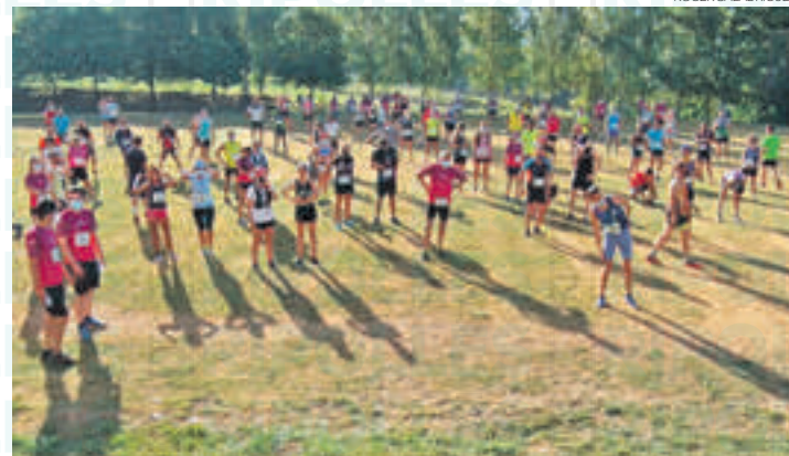
Els participants de la cursa de l'any passat a punt de sortir