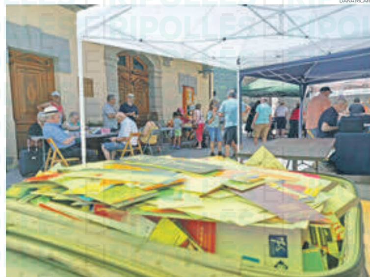
Van participar-hi col·leccionistes d'arreu de Catalunya

Al municipi hi ha força afició a aquest tipus de col·leccionisme que també pot tenir beneficis per la salut: «Vaig veure que això m'anava molt bé per la memòria. Saber quins punts te-