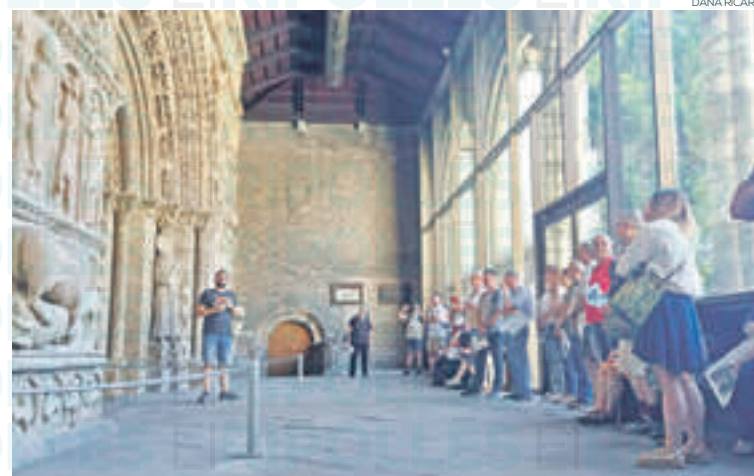
Dins el Monestir de Santa Maria hi ha fins a 8 punts literaris

poden ampliar la informació sobre el lloc i els textos mitjançant un codi QR que els adreça al portal endrets.cat. El passat cap de setmana es va dur a terme la inauguració de la ruta literària de Ripoll on es van visitar els diferents punts d'interès i es van llegir els textos correspo-