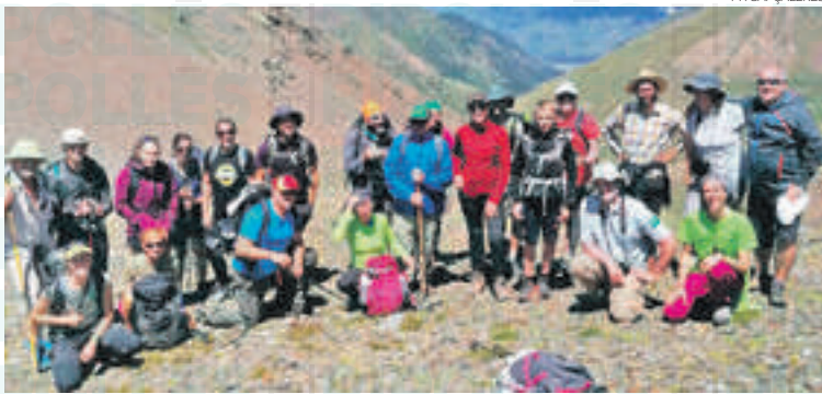
Tècnics d'ambdós espais protegits van trobar-se al coll d'Eina

i a la fi, es tracta d'un territori amb les mateixes característiques pel que fa a ecosistemes, per tant, les línies de treball podrien molt bé ser conjuntes si s'estableixen sinergies. Durant la trobada transfronterera tampoc hi va faltar la música i les danses, en aquesta ocasió al so de l'acordió. Els participants també van poder degustar productes agroalimentaris de proximitat. Després de l'experiència asseguren a través de xarxes socials que « Seguirem treballant junts! ».