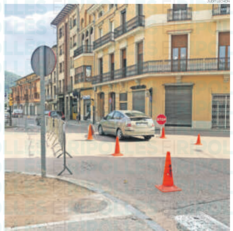
El punt del tall de circulació durant la prova pilot