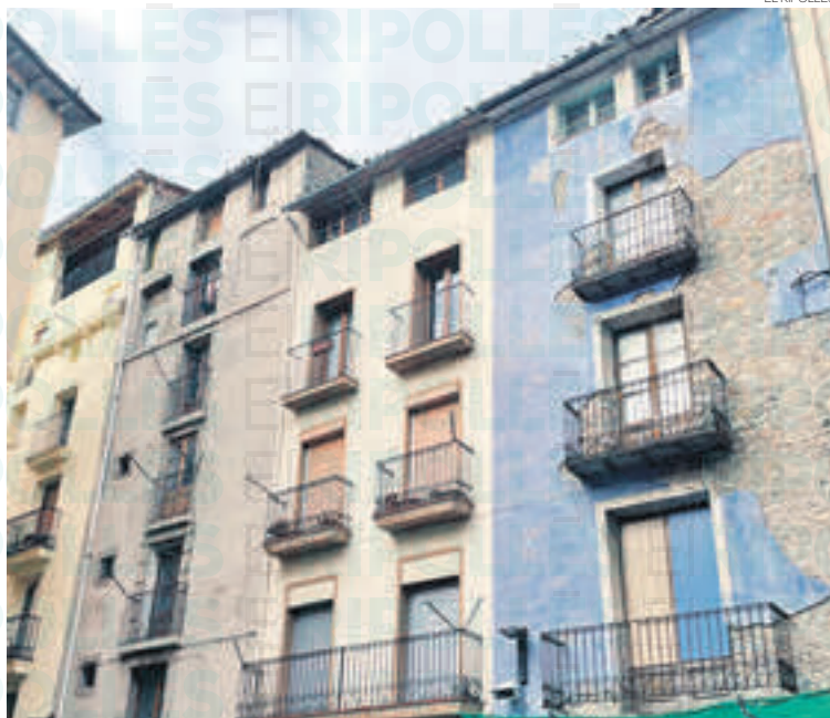
Les subvencions aniran destinades a millorar l'oferta d'habitatge d'ús social

Per a inversions destinades a polítiques socials es repartiran 656.603,18 euros a vint-i-vuit ajuntaments. Al Ripollès, a Vallfogona de Ripollès, Pardines, Ribes de Freser i Ripoll. Pel que fa a l'adquisició d'habitatge social seran 826.108,56 euros per a onze ajuntaments, i al Ripollès en serà beneficiari Ripoll. 422.476,03 euros per a estudis, plans, programes i projectes locals es repartiran entre cinquanta-un consistoris, al Ripollès: Gombrèn, Les Llosses, Ribes de Freser, Ripoll i Vallfogona de Ripollès.