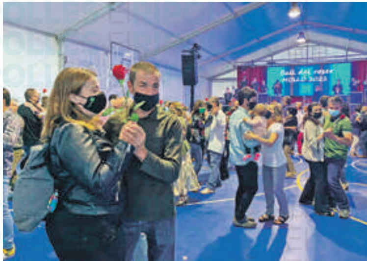
El ball del Roser tornarà sense mascaretes

Divendres la festivitats començarà amb un concurs de guarniment de balcons per tal de deixar els carrers ben engalanats per a l'ocasió. A la nit hi haurà el tradicional sopar de carmanyola a la plaça Major i, a continuació, el 'Xupinasso' d'inici de festa.