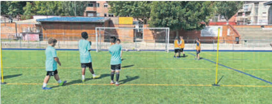
Participants en el campus AFO Futbol al municipal de Ripoll