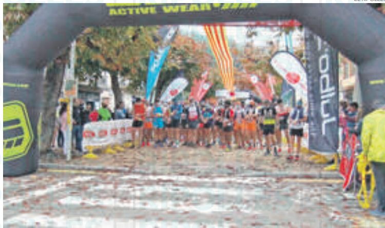
La sortida de la Taga Evo 2040, que també organitza la Unió Excursionista de Sant Joan

Tothom qui sigui major de 14 anys hi podrà participar i tindrà un temps màxim de 4 hores per fer tot el traçat. En cas de no superar els obstacles s'hauran d'enfrontar a una penalitza-