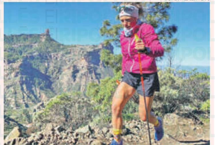
Tremps tornarà a les curses després d'unes setmanes d'inactivitat