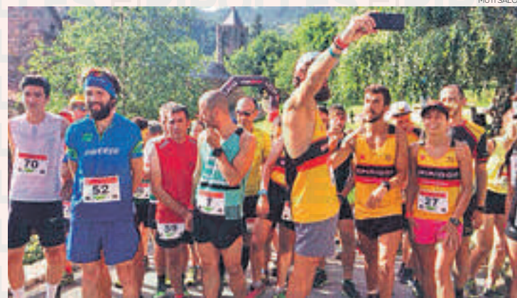
Fotografia de la primera edició de La Salvatge de Nevà, de l'any 2018