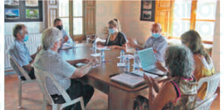
L'actual batllessa en el moment de la seva elecció a l'alcaldia

Tot i que encara és aviat per parlar de llistes definitives, el que està clar és que Cornellà tornarà a presentar-se per Junts per Catalunya, a l'espera de conèixer si el grup creixerà i si ella encapçalarà el pro-