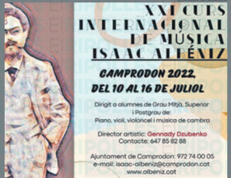
Cartell del curs

JA ÉS AQUÍ EL XXI CURS INTERNACIONAL DE MÚSICA ISAAC ALBÉNIZ