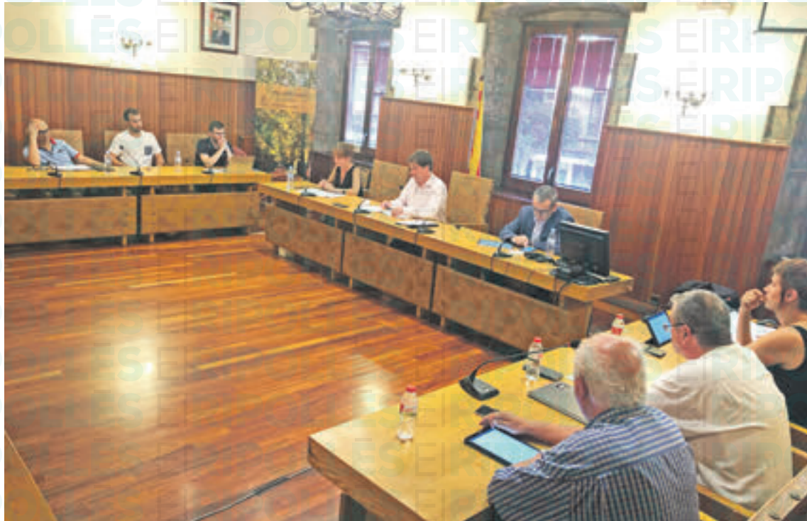
El ple de Camprodon del passat dilluns

Més a llarg termini, una de les portes per solucionar el pro-