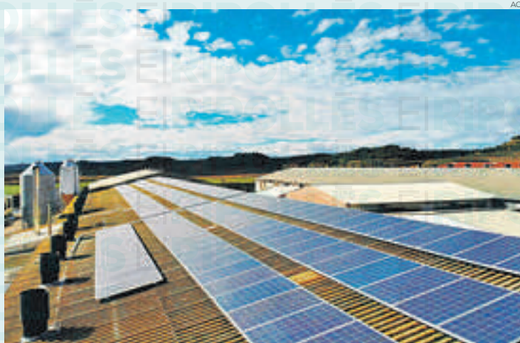
No es preveuen complir els objectius 2030 a Catalunya

bles, segons es van comprometre els governs en el marc de la llei contra el canvi climàtic del 2017. Com a molt s'espera arribar al 30%, ja que el govern català reconeixia a principis d'aquest 2022, que veu molt difícil arribar als objectius marcats per al 2030. Cada gest compta i, per tant, estudis com els exposats al Ripollès són de vital importància per la transició energètica.