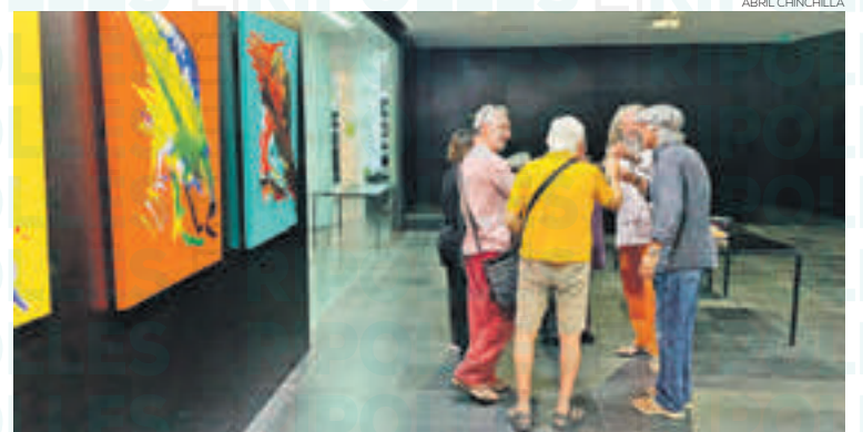
Inauguració de l'exposició a la biblioteca de Ripoll

i ofrena dels pans. A la tarda un bingo popular va animar l'ambient fins al sopar popular el qual va comptar amb una bona participació. Un acte molt adequat per cloure el primer dia de gresca. El diumenge va ser torn dels més petits, els quals van poder gaudir d'una xocolatada. I per fer passar la calor, la festa major va cloure amb una festa de l'escuma per als infants, tot i que segur que algun de gran també s'hi va animar.