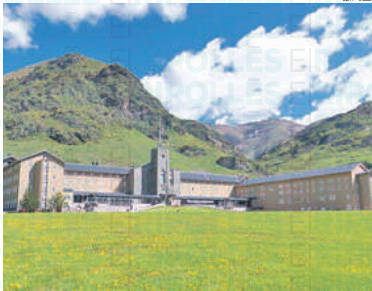
Es promouran diverses accions de millora a Vall de Núria i Vallter

Al parc natural del Ripollès es duran a terme accions a Vall de