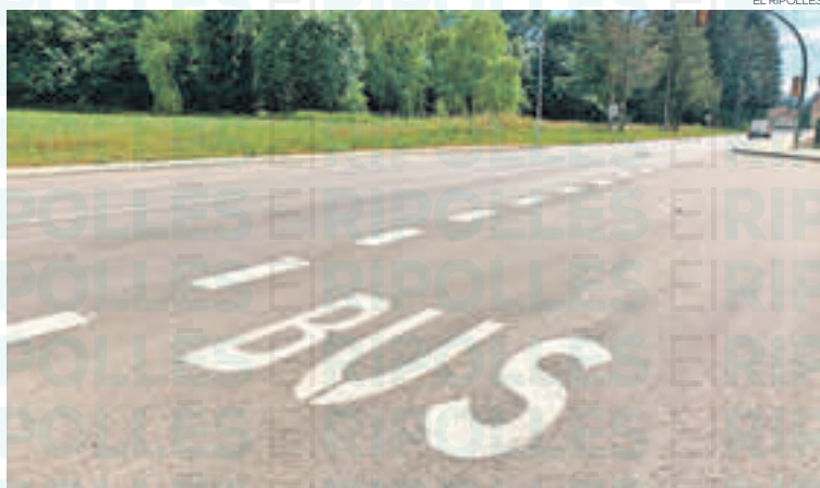
Parada dels autobusos a la colònia Llaudet de Sant Joan de les Abadesses