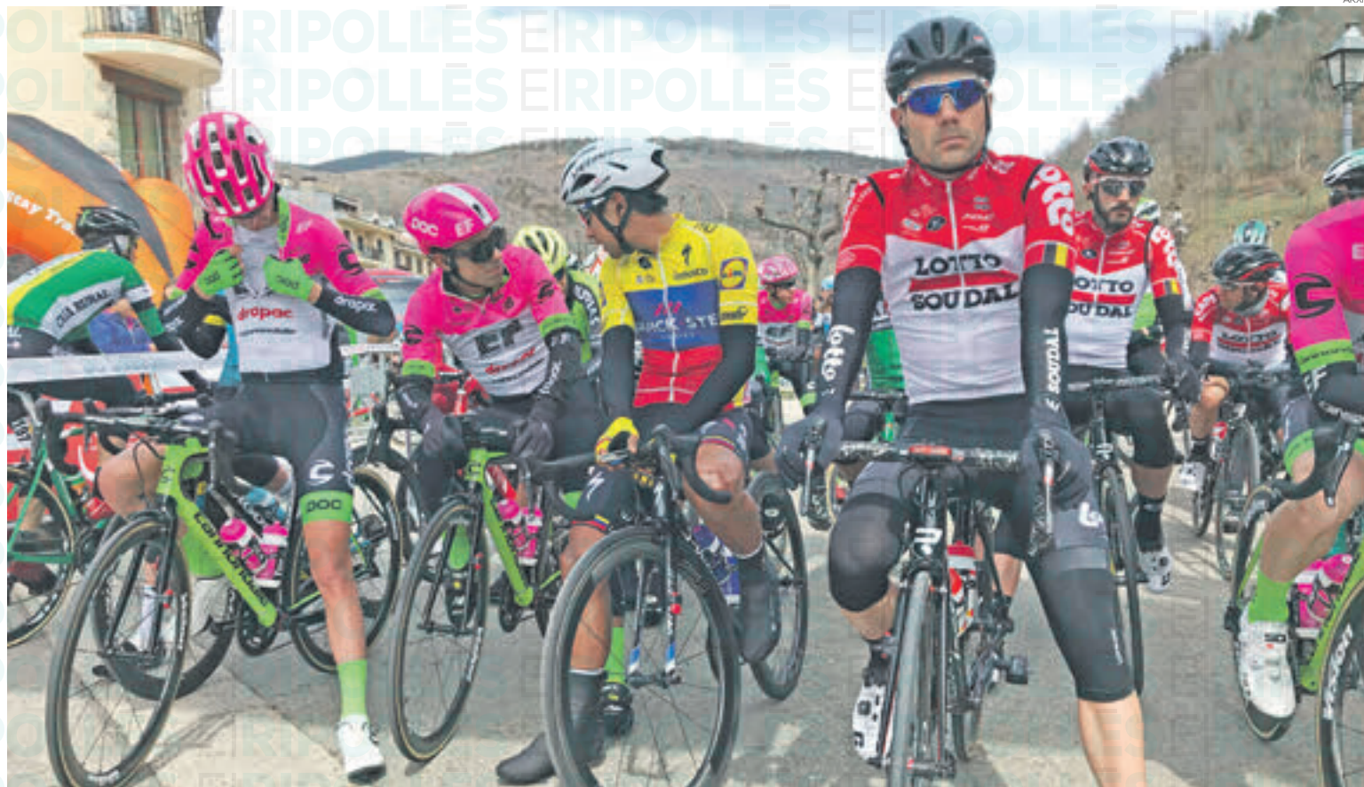
Llanars va ser sortida d'etapa de la Volta l'any 2019

«Estem segurs que, novament, tornarem a viure-hi una gran festa del ciclisme, i per nosaltres és un plaer seguir comptant amb la col·laboració de les esta-