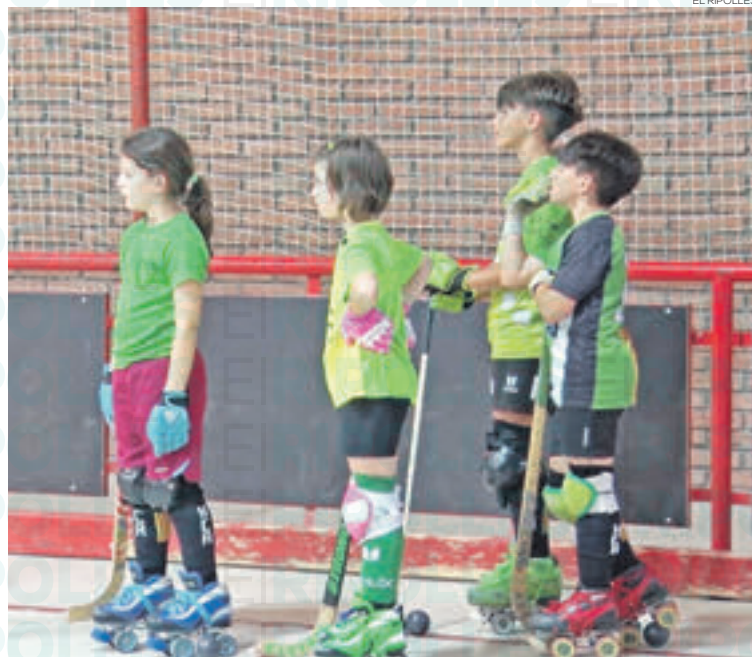
Participants en el campus de tecnificació de l'HC Ripoll

La proposta es dirigeix a diferents categories: el grup d'escola, el prebenjamí, el benjamí, el segon grup d'alevins i el femení. Les sessions s'organitzen en dos torns en funció d'aquestes seccions i, fins ara, compten amb una participació