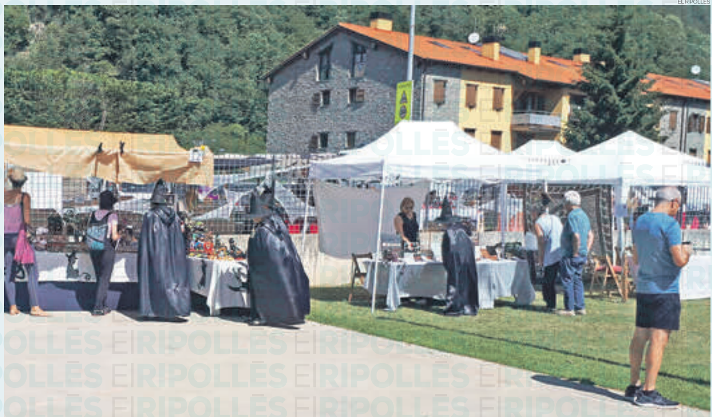
SANT PAU DE SEGÚRIES REDACCIÓ

CAMPDEVÀNOL TAMBÉ OFEREIX MÚSICA EN DIRECTE AMB EL CLAVETAIRES