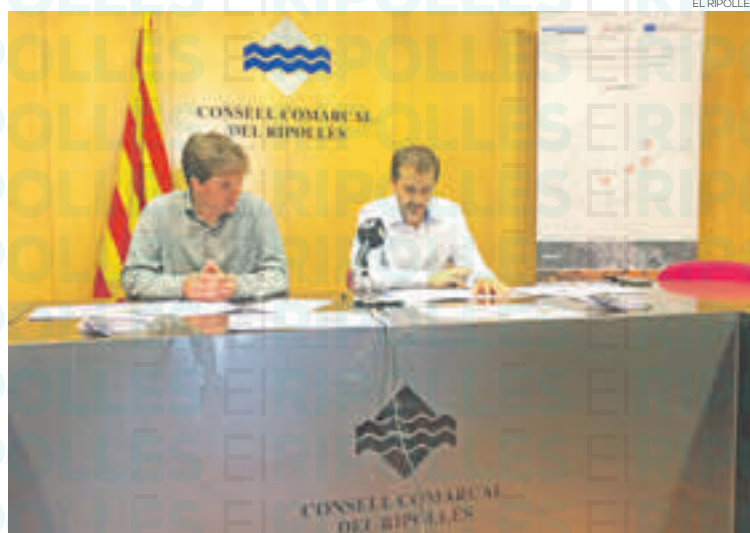
Presentació del nou producte turístic a la seu del Consell Comarcal

amb punts concrets on es poden desenvolupar les activitats que proposa la webapp, des d'exercicis de moviment, meditació, observació o escriptura. A Ripoll l'espai és al voral el Ter, « més