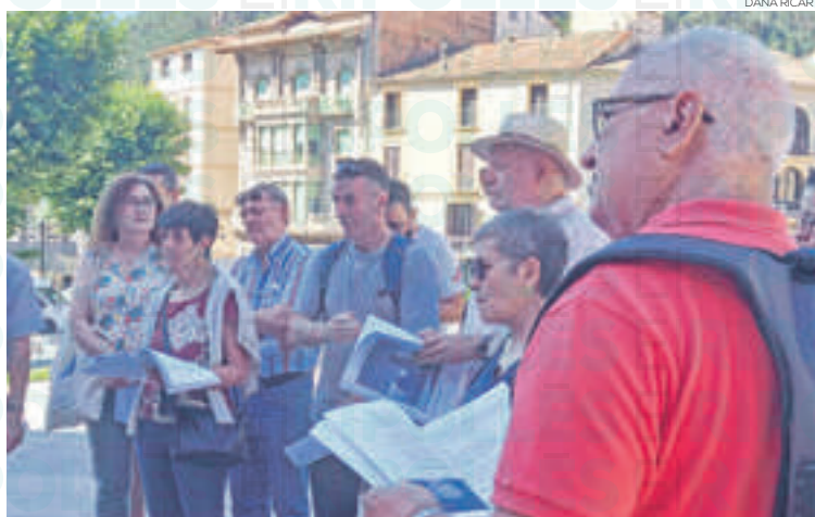
Durant la inauguració es van llegir alguns dels textos