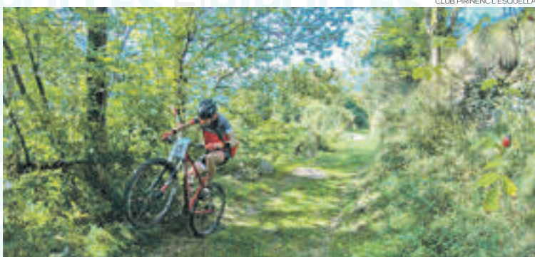
Imatge del Club Pirinenc l'Esquella