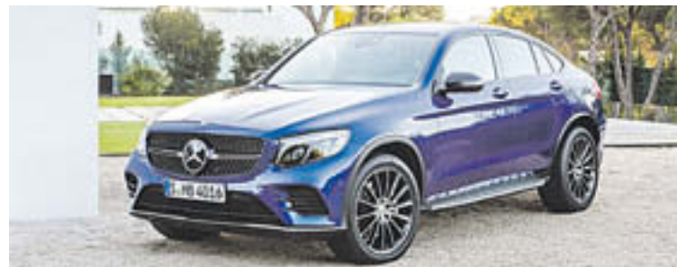
Aquest Mercedes, el germà petit del GLC Coupé