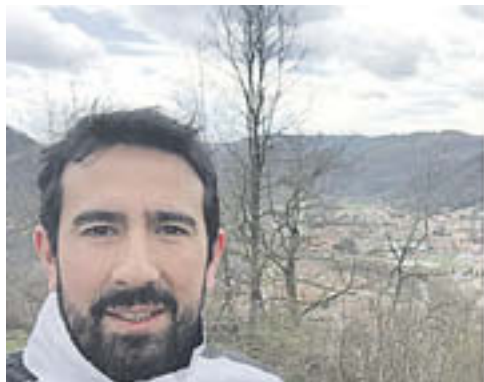
Xavier Cima va fer pública la decisió a través del compte d'Instagram

El ripollès, alhora, deslliga la decisió al fet que mantingui una relació sentimental amb la líder de Ciutadans a Catalunya i cap de l'oposició al Parlament, Inés Arrimadas, i