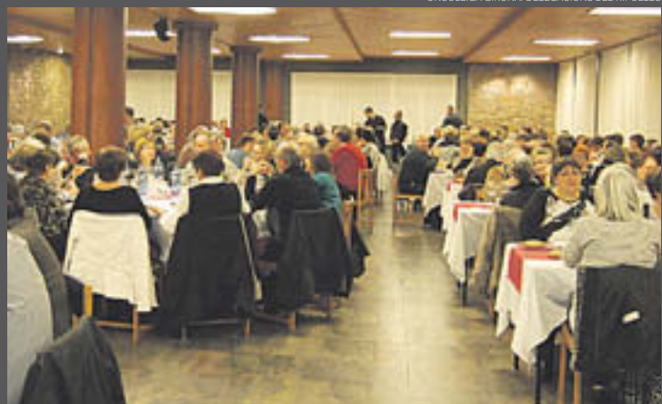
El sopar va omplir La Solana del Ter

ONCOLLIGA GIRONA/DELEGACIONS DEL RIPOLLÈS