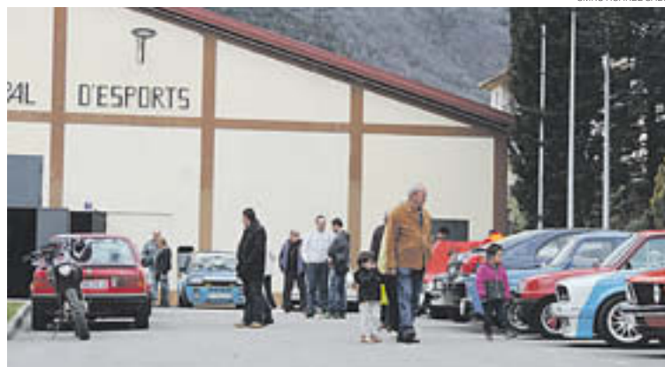
Els cotxes es van exposar a davant del Pavelló Municipal

Ribes de Freser va acollir aquest passat diumenge la I Trobada de Cotxes Clàssics de Ribes de Freser. Una cinquantena de vehicles de tota mena –i els seus propietaris– es van aplegar davant del Pavelló Municipal de Ribes. Després de l'esmorzar de germanor, es va fer una ruta per alguns carrers del poble amb els cotxes. L'organització es mostrava satisfeta de la trobada i va anunciar que la intenció és repetir la trobada l'any vinent.