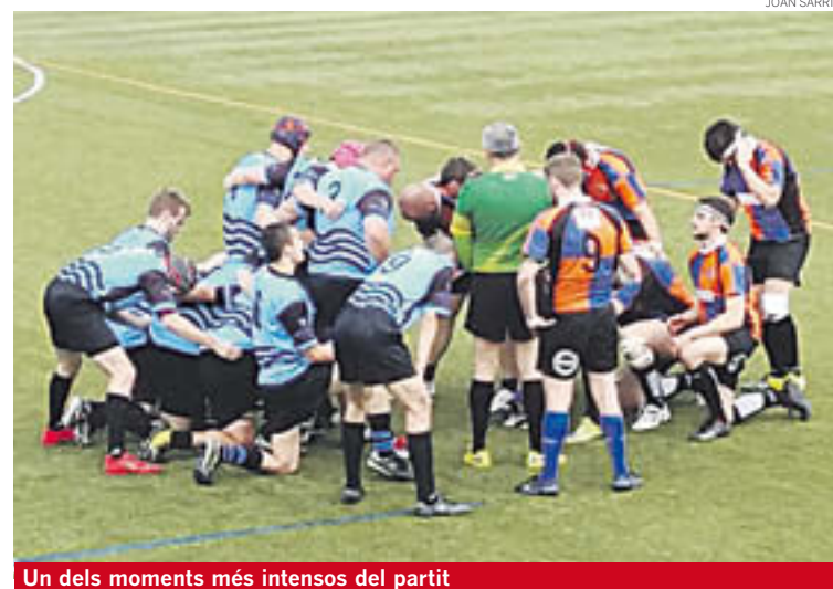
Un dels moments més intensos del partit

El Ripollès Rugby Club es va acomiadar de la seva afició amb una derrota davant el líder, el Badalona RC, que va mostrar la seva fortalesa per imposar-se per un clar 5 a 44. Els ripollesos tancaran ara la lliga a Terrassa, davant el Carboners. El partit d'aquest dissabte passat no va tenir gaire història, ja que els visitants, que s'estaven jugant la lliga en aquesta fase, van sortir amb una gran intensitat i ja al descans guanyaven per 5 a 22. A la segona part, el Badalona va continuar sumant marques i jugant amb la intensitat dels primers 40 minuts per acabar imposant-se per aquest clar 5 a 44. El president del Ripollès RC, Xavier Prat, explica que «no ens han donat op-