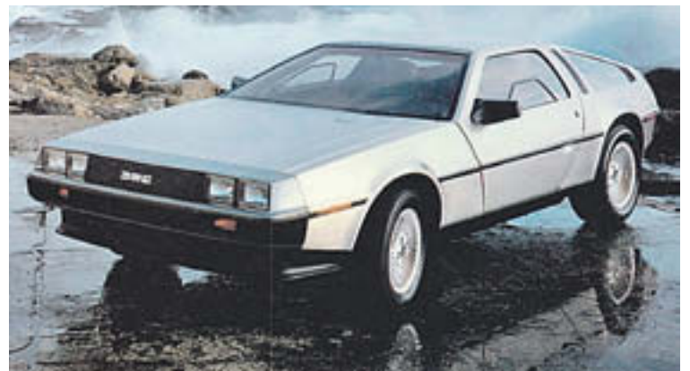
El DeLorean, primer i únic model de cotxes de la companyia

potència, el Batmòbil Tumbler, que a més, era absolutament funcional.