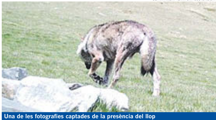
Una de les fotografies captades de la presència del llop

Noves fotografies tornen a demostrar la presència de llops al Ripollès. Fotografies aconseguïdes per tècnics del departament de Territori i Sostenibilitat que estan fent un seguiment d'aquesta espècie protegida. Durant el 2015 es van instal·lar en punts estratègics vuit càmeres fotogràfiques per intentar-ne detectar la presència, igual que es fa amb l'ós. Es disparen de manera automàtica amb el moviment d'algun animal i s'han fet nou observacions del llop que els tècnics han considerat fiables. Sis d'elles al Ripollès, i la resta, a la Cerdanya. Malgrat això, no es pot determinar si es tracta del mateix indivi-