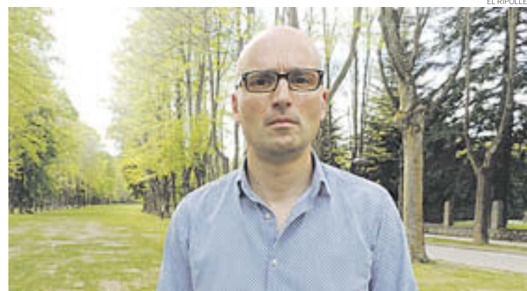
L'alcalde de Camprdon està a l'espera de la convocatòria del consell d'alcaldes

Des de Camprdon, en aquesta direcció, es mostra la predispo-