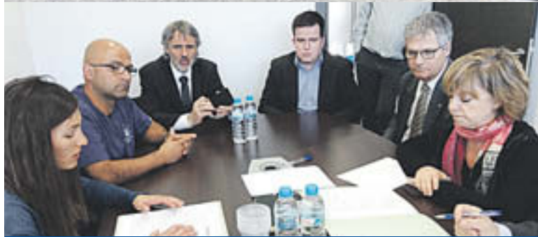
Diversos moments de la visita de la consellera de Governació, Meritxell Borràs, a la comarca del Ripollès

social» en el poble més disseminat del Ripollès.