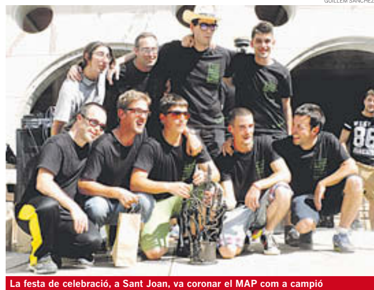
La festa de celebració, a Sant Joan, va coronar el MAP com a campió