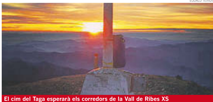
El cim del Taga esperarà els corredors de la Vall de Ribes XS

proposat per la competició del diumenge. L'organització d'Espai Trail ha confirmat que la resta de modificacions en els recorreguts o situacions són «insignificants» en comparació amb els de la tercera edició. Segons Guinovart, aquest 2016 volen que la Vall de Ribes XS «es consolidi i que la gent la tingui situada en el calendari». Segons Guinovart, «és una prova exigent i espectacular, que passa per dos cims com Sant Amand i el Taga», que permeten gaudir d'un entorn natural i d'un paisatge singular del Ripollès. Dissabte, des de les 11 del matí, també se celebrarà la Vertical XS, una prova «diferent, ràpida i explosiva», consistent en la pujada des de la Font de la Margarideta fins al cim del Taga. L'objectiu és cobrir els 4,6 quilòmetres de distància i el desnivell d'uns 1.110 metres en el menor temps possible. Aquesta modalitat també és puntuable pel Campionat del Km Vertical (primera prova del 2016). L'organització espera repetir els 350 o 400 corredors que ja van assistir a Ribes de Freser en la tercera edició de la cursa.