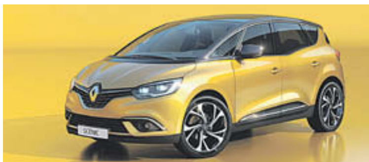
L'Scénic, un monovolum renovat