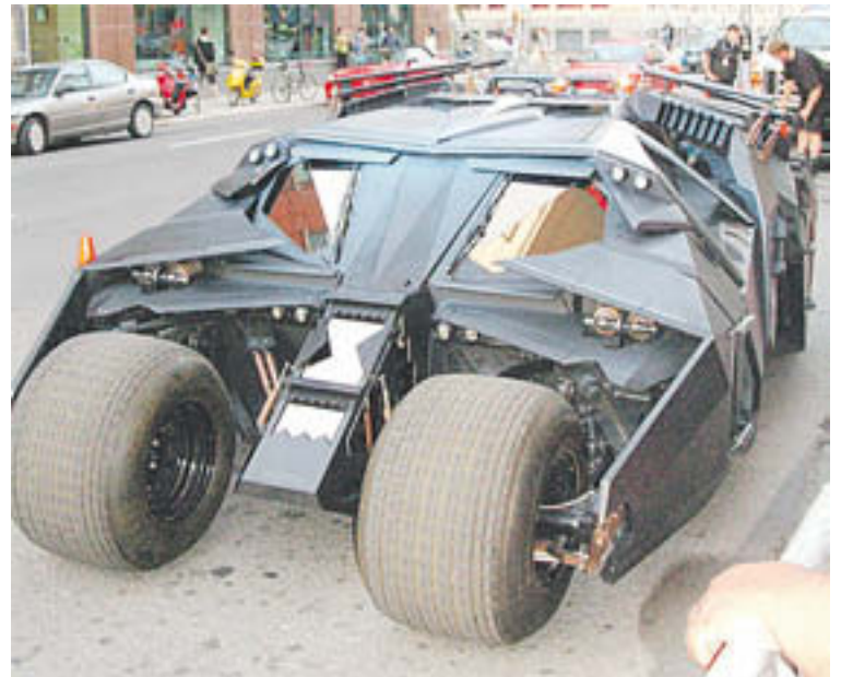
El Batmòbil, a banda d'espectacular, funcional

James Bond és una de les sèries de pel·lícula que ha marcat més tendència, també pel que fa a motor, amb l' Aston Martin DB5 , el vehicle que utilitzava aquest popular espia. Fa uns anys es va subhastar el que havia conduït Sean Connery a Goldfinger i Thunderball per uns 2,98 milions d'euros. El Ford Torino de l'any 1976 de la parella de policies més incansable de les sèries americanes Starsky & Hutch també va impactar a les retines dels espectadors, sobretot pel seu color vermell amb una ratlla blanca que solcava pels carrers de la ciutat a tota velocitat. També un Ford era el de la pel·lícula Bullit que va conduir l'any 1968 Steve McQueen. Un Ford Mustang GT 390 va protagonitzar el que s'ha considerat com una de les millors escenes de persecució per San Francisco. També d'impacte, però per la barreja d'estils, el Batmòbil , que era un híbrid tot terreny, esportiu i tanc propulsat per un motor de V8 de 5.0 litres i 500 cavalls de