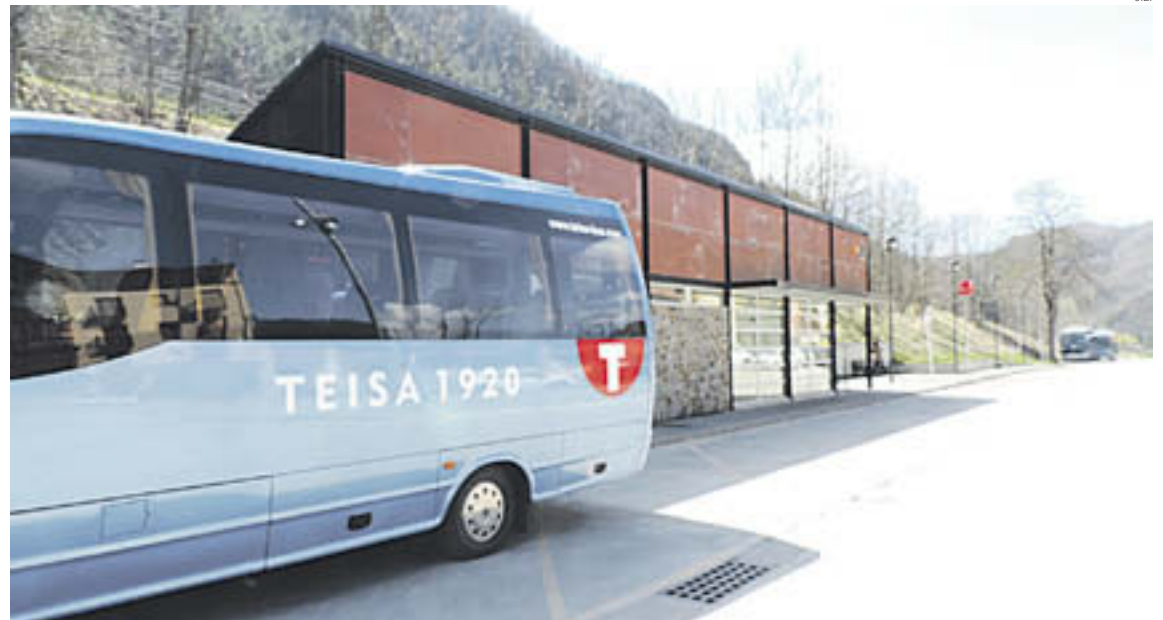
Parada del bus a Camprodon