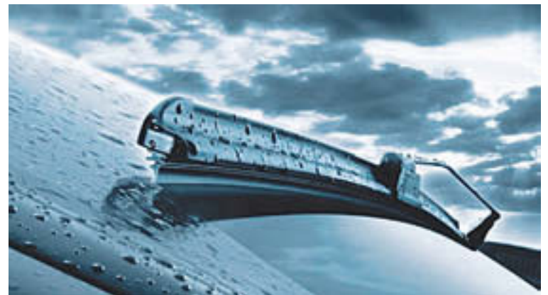
Els braços dels eixugaparabrises han d'estar en bones condicions