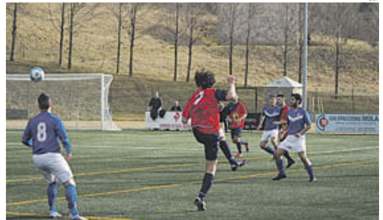
El Camprodon jugarà dimecres que ve el partit contra el Blanes