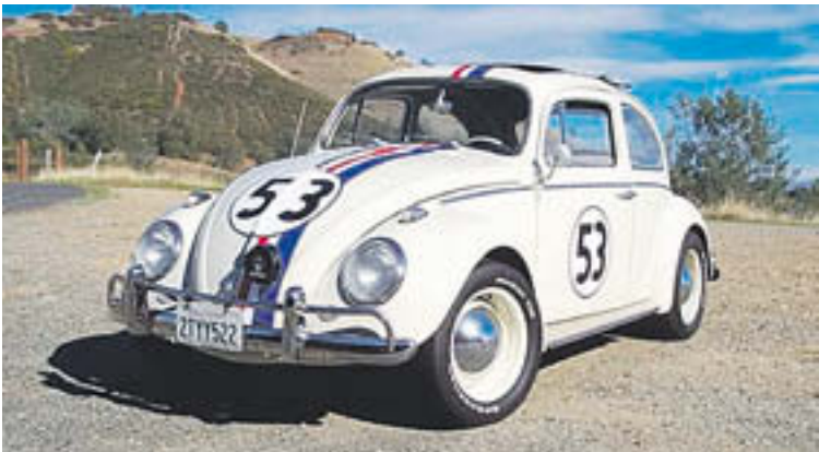
El mític Herbie, un cotxe de curses i amb vida pròpia