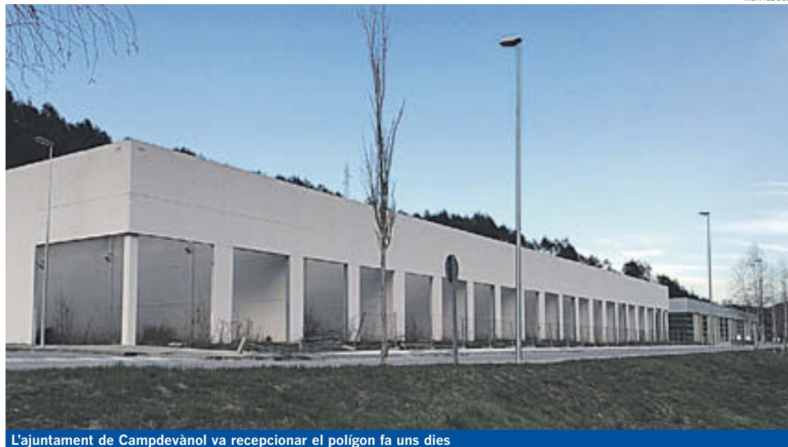
L'ajuntament de Campdevàrol va recepcionar el polígon fa uns dies