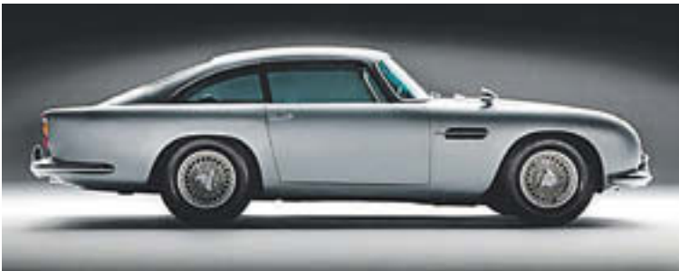
El mític Aston Martin de la sèrie de pel·lícules de James Bond