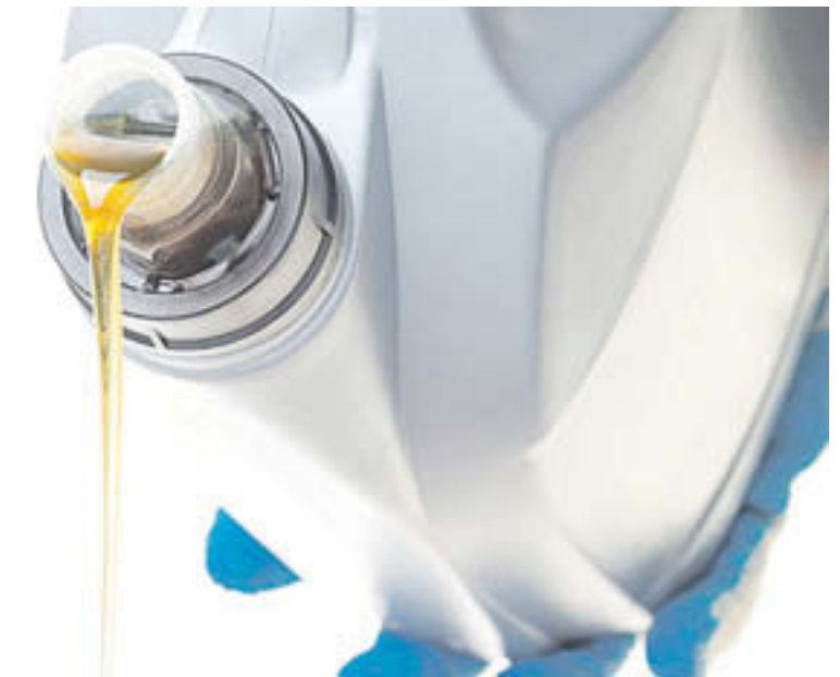
L'oli s'ha de canviar abans dels 30.000 km

Pel que fa a la neteja dels vidres s'han de fer servir tovalloles de microfibra o també diaris, perquè la tinta actua com a solvent i el paper moll no deixa borrisol. Un cop s'asseca el vidre convé aplicar-hi un producte indicat per a la neteja dels vidres.