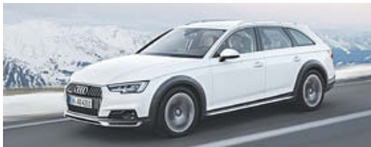
L'Audi A4 allroad, a la venda aquest estiu

Les marques de cotxes estan presentant, des de principis d'any, les que seran les apostes de models ja existents i també de nous. És el cas, per exemple, del millorat Audi A4 allroad quatre 2016, que estarà disponible a l'estiu amb lleugers canvis estètics i amb millores substancials: del maleter, amb una mecànica més eficient, tracció total quatre de sèrie, un increment de la carrosseria de 23 mm i més perfil de rodes. Aquest model ja es va poder veure al Saló de l'Automòbil de Detroit d'aquest any. Altres models que aviat es podran veure a la carretera seran els de la marca Mercedes. Un d'aquests, a tall d'exemple, serà el GLC Coupé que es presentarà al Saló de Nova York. Aquest és el germà petit del Mercedes GLE Coupé, amb una gama de fins a 8 propulsors, entre dièsel, gasolina i híbrid. Altres models que estan a punt de sortir