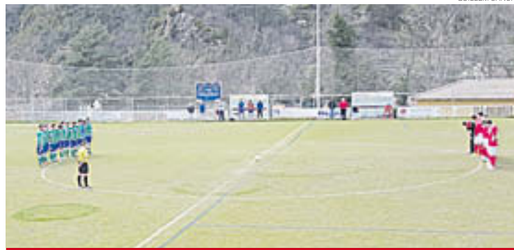
El camp de Ribes, fent el minut de silenci abans del partit

tra el Corcó (1 a 4), els jugadors d'ambdós equips, els entrenadors i aficionats van guardar un sentit minut de silenci en la seva memòria. Un acte i record cap a Enric Requena que segurament s'ampliarà de cara a l'estiu o a principis de la temporada vinent.