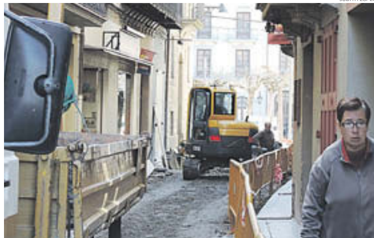
Els operaris treballen des de Setmana Santa en les obres