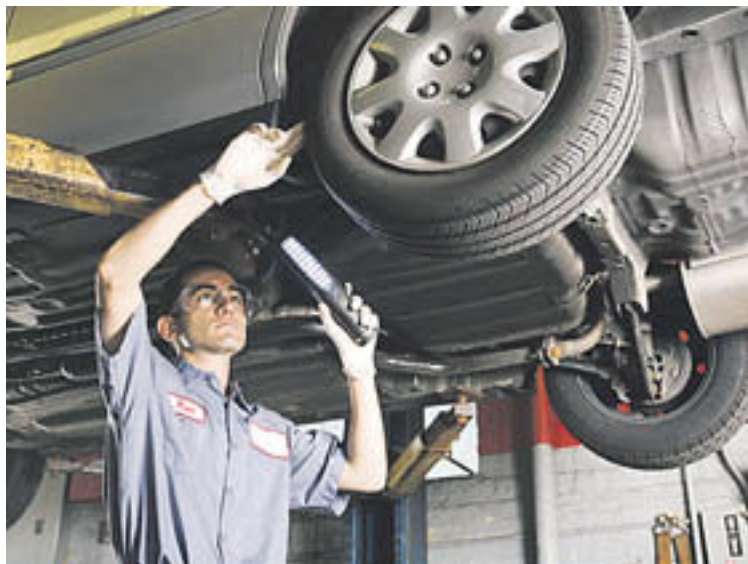
La pressió de les rodes depèn de cada fabricant

més si es realitzen desplaçaments curts, que no si es fan distàncies llargues per carretera. Tenir-ne cura és importantíssim, ja que si l'oli no està en bon estat, pot causar un desgast prematur del vehicle. En aquest sentit, els símptomes serien un consum més elevat de l'oli. En cap cas s'haurien de superar els 30.000 km amb el mateix oli.