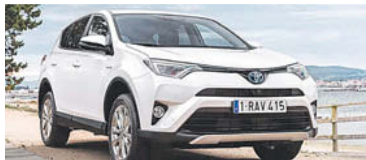
Toyota tindrà el primer SUV del fabricant

és l' Scénic 2016, el nou monovolum, amb llantes de 16 polzades a tota la gama, carrosseria amb dos