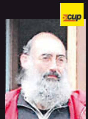
SANTI LLAGOSTERA CUP