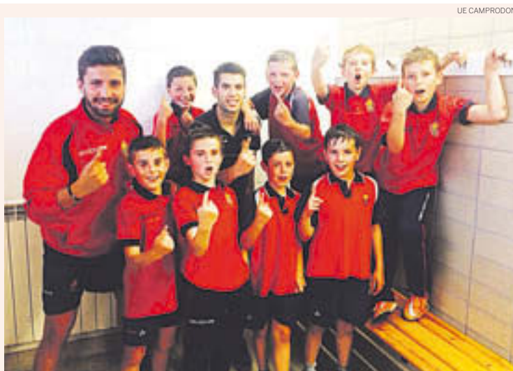
El conjunt camprodoní celebrant el títol de lliga