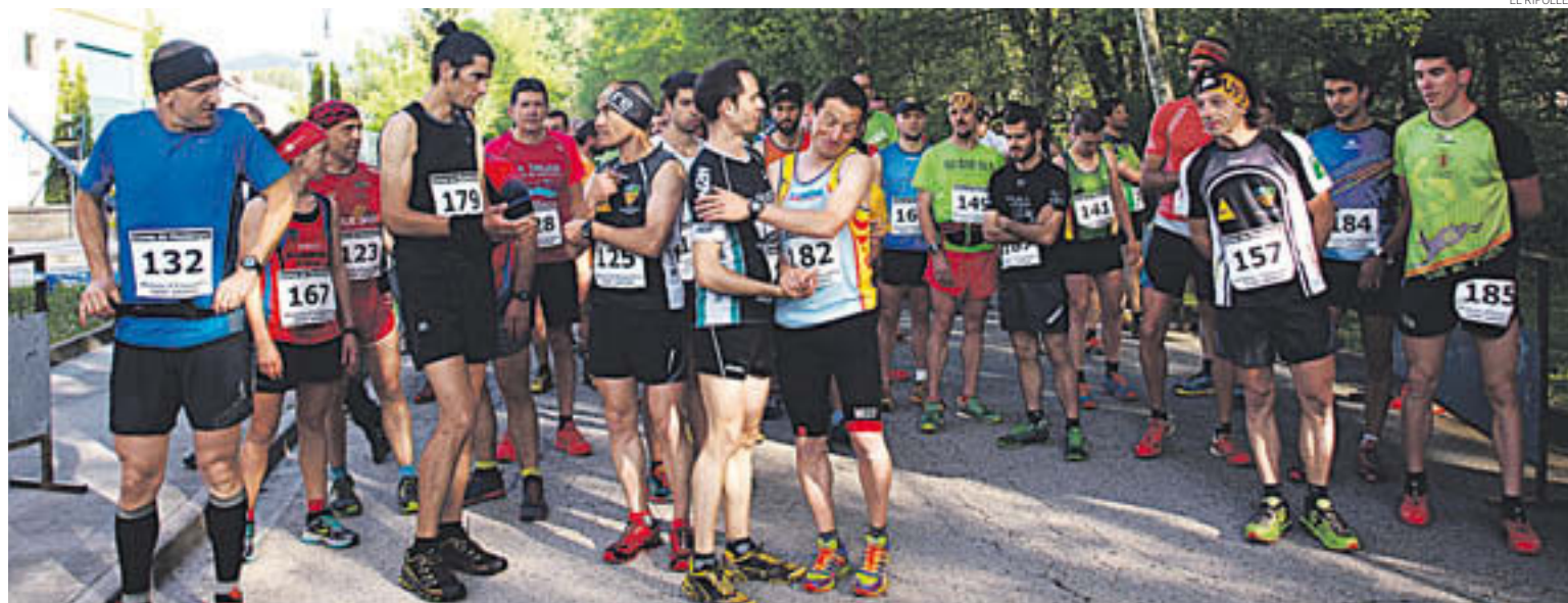
La Batega al Bac arriba després de la Cursa de Sant Amand de Ripoll

es disputarà diumenge i és la Batega al Bac Vertical, quilòmetre vertical explosiu ideal per els corredors que tinguin més potència.