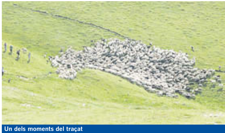
Un dels moments del traçat