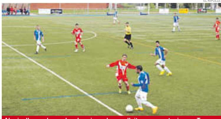
Als ripollesos els queden dues jornades per lluitar per mantenir-se a Tercera

La realitat és que encara els queden dues oportunitats més per mantenir-se dins la Tercera Catalana i aconseguir no descendir en una categoria inferior però els rivals seran difícils perquè