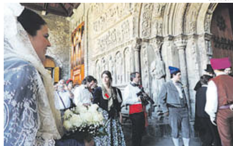
La núvia i el seu pare esperant per entrar a la Portalada