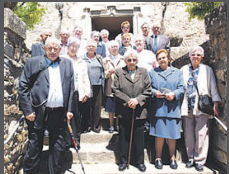
La trentena d'avis que Gombren va homenatjar