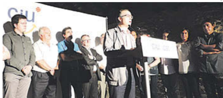
Els caps de llista de CiU de la comarca del Ripollès