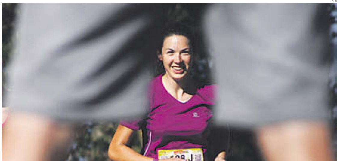
Els corredors van gaudir del recorregut