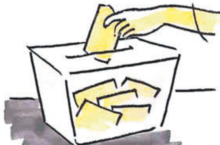
Diumenge els ripollesos estan citats a les urnes