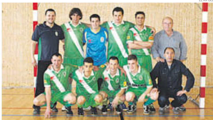
Una de les formacions de l'EFS Ripoll aquesta temporada

■ D'aquesta manera els de Carles Vigara posen el punt i final a la temporada 2014-2015