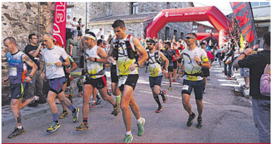
A la cursa hi van participar aproximadament 180 corredors

L'objectiu de tots ara és continuar treballant per potenciar aquesta prova i convertir-la en un referent i un atractiu de la zona.