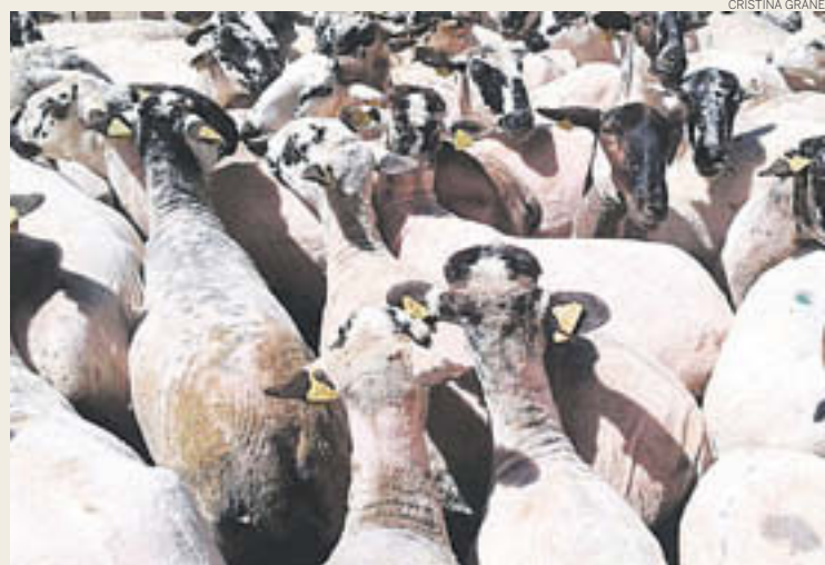
El bestiar va estar tot el matí a la plaça de l'Ajuntament