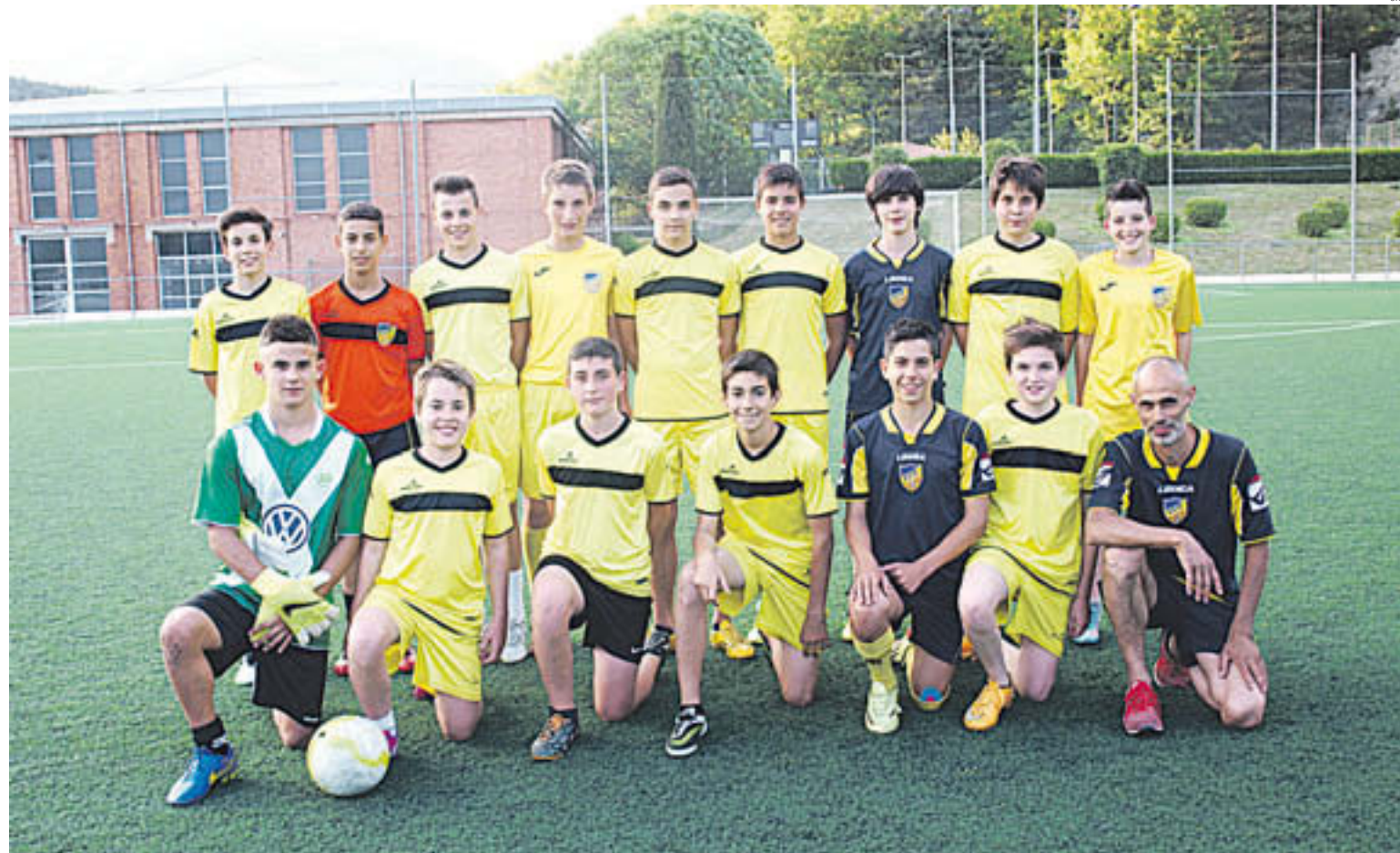
Aquests són els components de l'Infantil "A" de l'Escola de Futbol del Ripollès en aquesta temporada 2014-2015