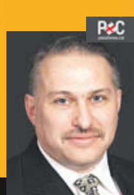
PEP SORT PXC