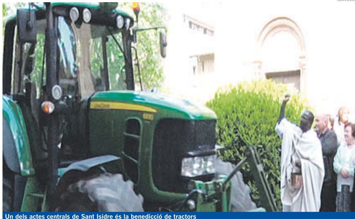
Un dels actes centrals de Sant Isidre és la benedicció de tractors