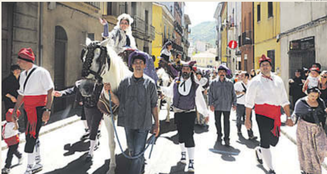
La núvia, amb la seva comitiva, pujant el carrer Bisbe Morgades

Al seu voltant curiosos, tant ripollesos com forans, no es volien perdre l'espectacle i gairebé l'ocasió única al llarg de l'any de veure com les esquilen. A més a més, no ho fan de qualsevol manera, sinó com ho feien abans els pastors de la comarca, amb tisora