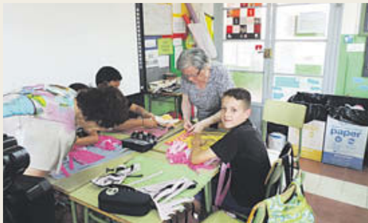
Els alumnes del Joan Maragall en plena activitat

El centre ripollès espera que una experiència similar tingui continuïtat el curs que ve perquè és