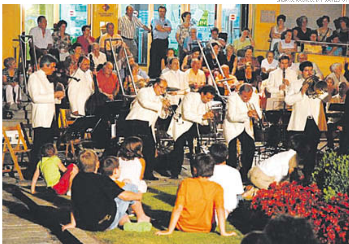
Un dels moments de la tradicional serenata

La Festa Major de Sant Joan les Fonts 2015 es tancarà el dissabte 27 de juny amb tir al plat i les finals del torneig de pàdel. Però, sobretot, en aquest darrer dia destaca el teatre i el country a la fresca. A la tarda, a les vuit, la companyia Pic Pic interpretarà la comèdia "El Show Xou" que es farà al Centre Sociocultural i que a ben segur farà passar una bona estona a tots els assistents. A la nit l'apunt musical es concentrarà amb el country que es farà a la plaça Major i que servirà per posar el punt i final a cinc dies intensos de gresca i xerinxola en aquesta població de la comarca de la Garrotxa.