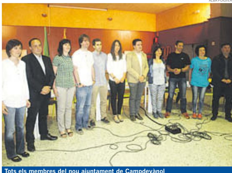
Tots els membres del nou ajuntament de Campdevànol