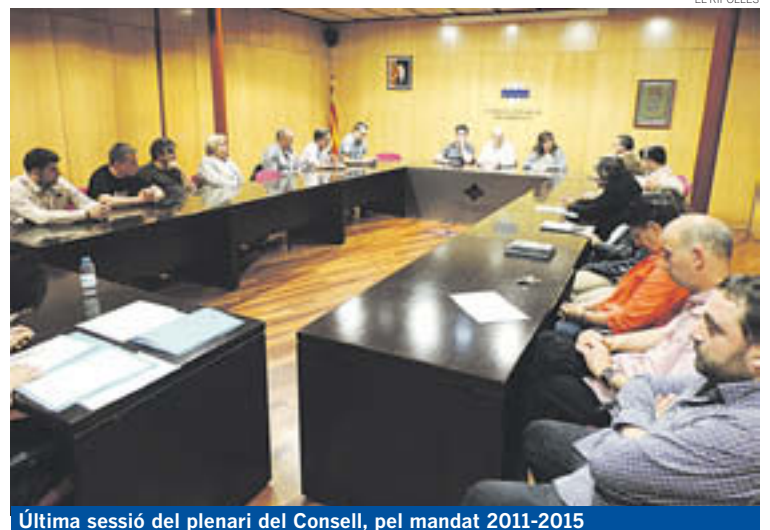
Última sessió del plenari del Consell, pel mandat 2011-2015