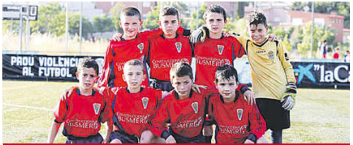
Equip benjamí del Camprodon, que va jugar per primer cop el Campionat de Catalunya

En total, vuit benjamins van ser els representants al campionat català, repartits en dos grups de quatre, on els dos primers de cada un passaven a les semifinals. El Camprodon va jugar al grup 1 contra el Nàstic de Manresa (divendres 12 de juny), el Reus i la Damm (dissabte 13). En el primer partit, tot i avançar-se al marcador per 1 a 0, els camprodonins van acabar perdent per 3 a 6,