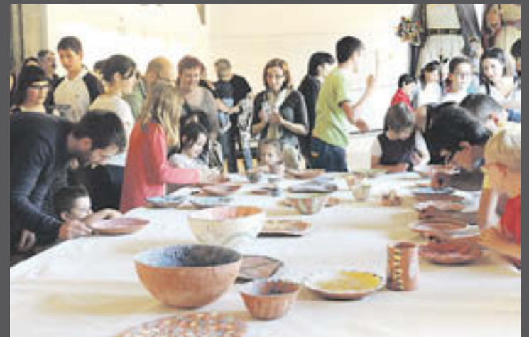
El "Va d'Art" celebrava enguany la seva vuitena edició