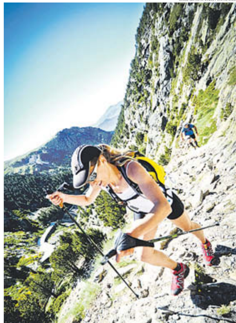
La cursa uneix Queralbs i Setcases amb dos recorreguts diferents