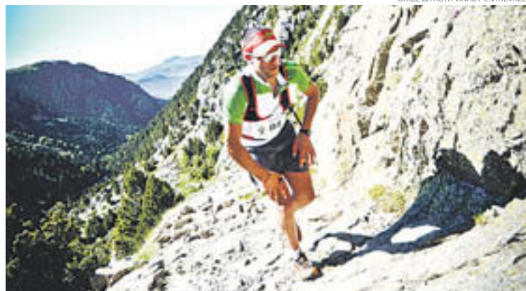
Aproximadament 250 corredors participaran a la prova