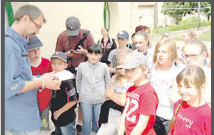
Aquesta trobada es va fer el dijous de la setmana passada