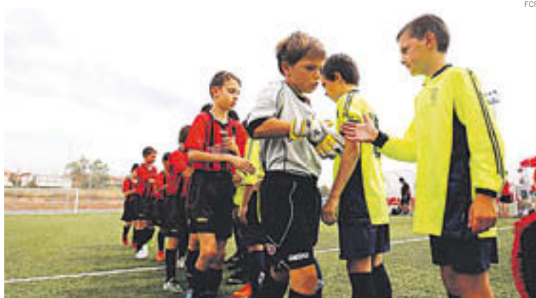
Un punt en tres partits, sumat contra el Reus (2 a 2)