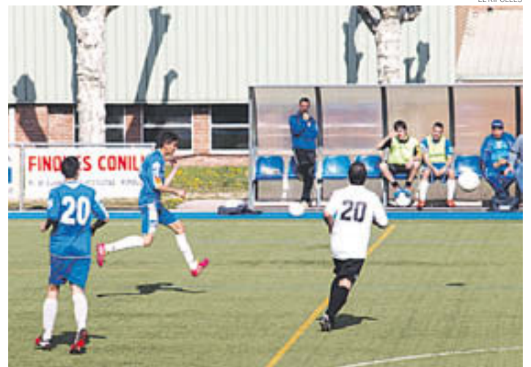
Si la FCF oficialitza la gestió, el Ripoll jugarà a Tercera el curs que ve