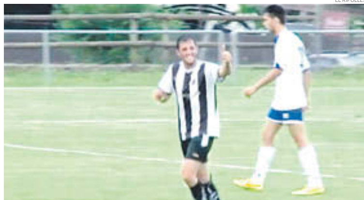
Tot i marcar ben d'hora, l'Abadessenc va patir per passar ronda a la Copa Catalunya

Els santjoanins es van avançar ràpidament al marcador, gràcies a una centrada per la banda dreta que va culminar el punta Pol Reixach amb una rematada de cap al primer pal, impossible per Busquets. Al cap de poc, els locals també ho van provar de cap arran d'un servei de banda en llarg, però Genís la va atrapar sense problemes per dalt. L'Abadessenc va controlar el joc al primer temps i en-