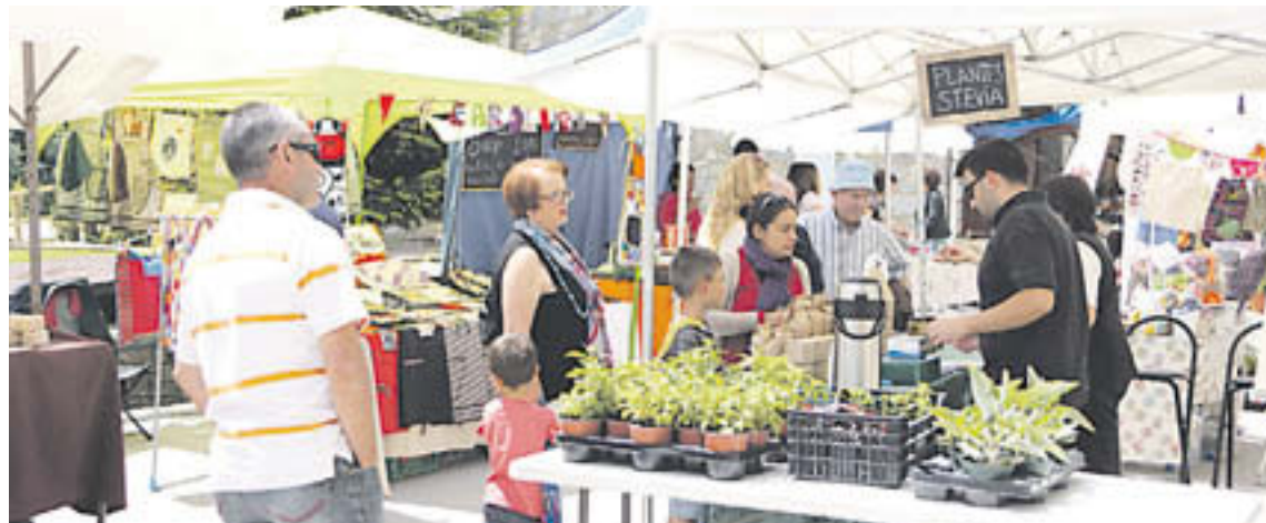
La fira va ser tot un èxit en aquesta edició

Les flors i herbes de muntanya van ser les protagonistes aquest cap de setmana a Setcases. La difusió de les seves propietats per a l'elaboració de plats i remeis medicinals va ser un dels objectius principals d'aquesta nova edició de la fira. Una difusió que va anar a càrrec d'una empresa especialitzada a la sala dels estudis, on també es van exposar exemples del tipus de flora que es pot trobar al terme municipal setcasí. El biòleg i botànic Evarist Marc va assegurar que «en aquests moments Setcases està preciós. Trobem flors arreu, ja sigui en els rius o en els prat i aquesta és la millor època per fer la fira. Hi ha hagut gent que els ha sorprès trobar algun tipus d'herbes que no esperaven, com les grelles i que podem trobar a les parets de la població i que ara està molt maca. A més es pot