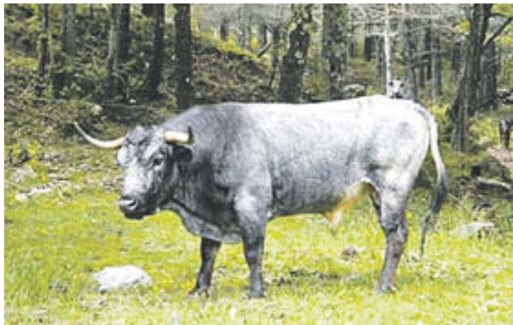
Un dels exemplars dels toros de lídia criats a Camprodon

• Veiem que les pastures aquí no són planes, tal com se solen veure