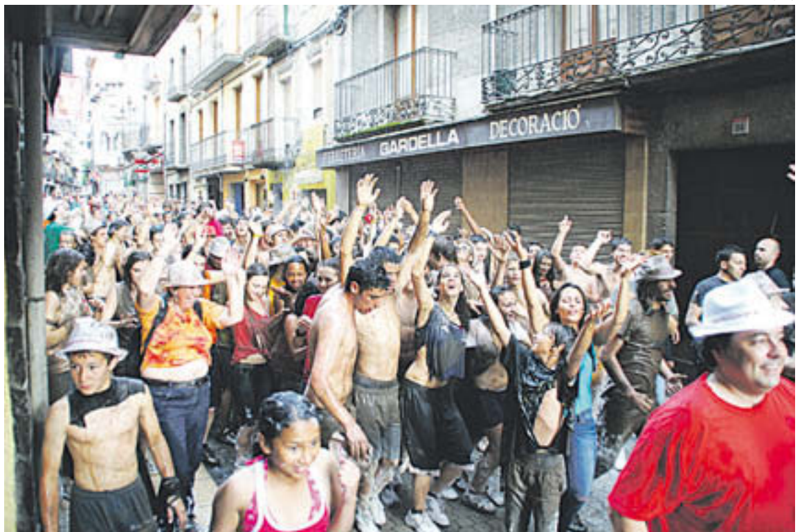
L'anada a la font és una de les activitats més singulars de la Festa Major de Camprodon

FESTA MAJOR DE CAMPRODON SANT PATLLARI 2015