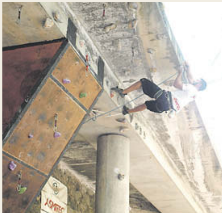
La competició va deixar imatges molt espectaculars

Des de la mateixa organització consideraven que el món de l'escalada cada vegada té més adeptes a la nostra comarca i són moltes les persones de fora que també venen a practicar-la al Ripollès. «Rutes com la de Montgrony són algunes de les més utilitzades i que, a més, donen un prestigi a la nostra comarca. Hi ha molta gent de fora que ve per provar aquestes vies. A més, també cada cop és més la