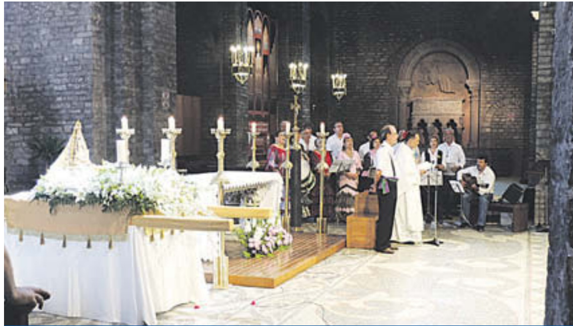
La Casa Cultural Andalus va celebrar una missa al Monestir de Ripoll