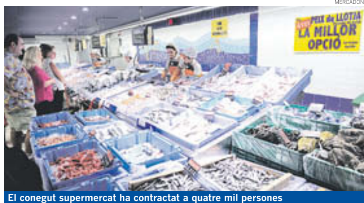
El conegut supermercat ha contractat a quatre mil persones

Des de començament d'any fins ara, la companyia ha obert 17 de les 60 noves botigues previstes per al 2015, fet que ha suposat una inversió conjunta de 54 milions d'euros. En el procés de construcció de cadascuna d'elles han treballat, de mitjana, prop de 60 PIMES i un centenar de persones.