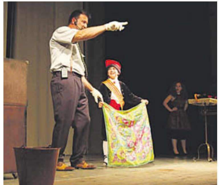
El mag Fèlix va fer passar una bona estona a petits i grans