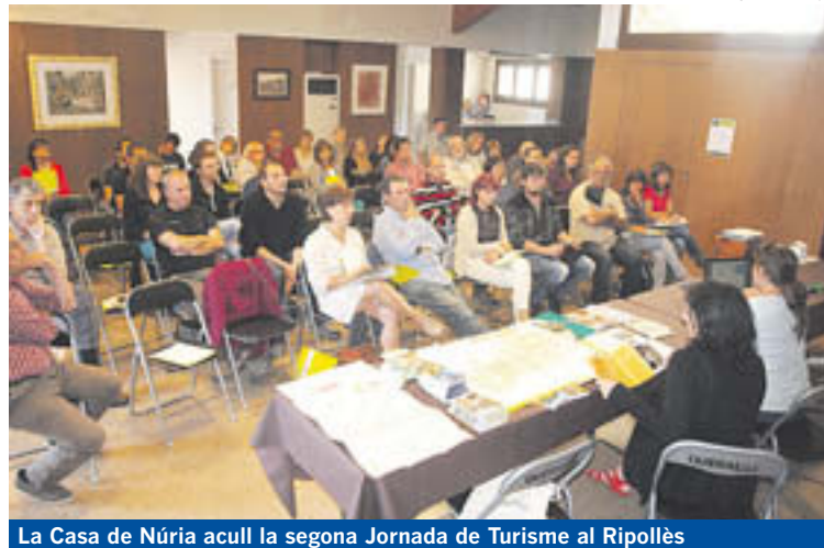
La Casa de Núria acull la segona Jornada de Turisme al Ripollès