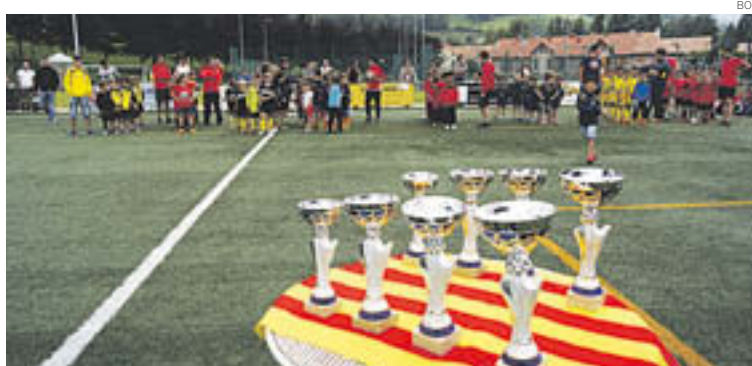
Tots els equips es van endur un trofeu a casa