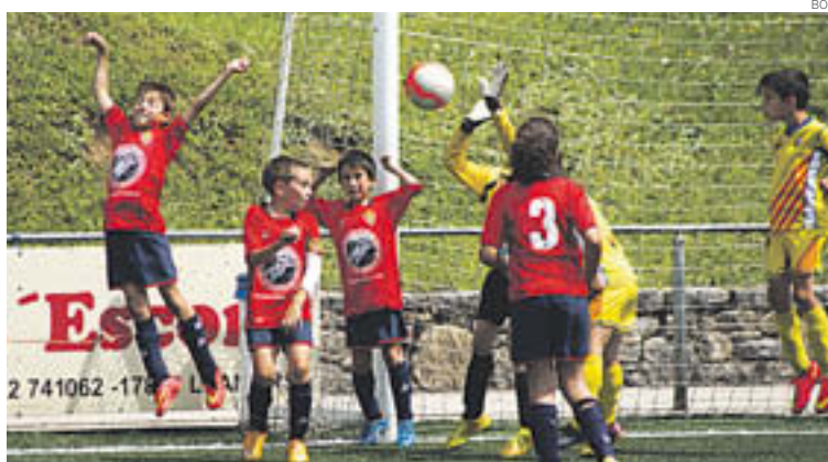
Els més petits van gaudir d'una matinal de futbol el diumenge