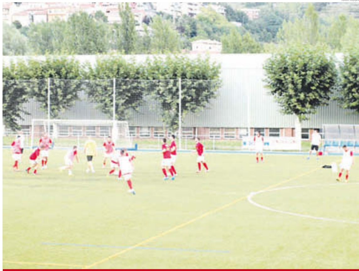
El futbol tornarà el diumenge a la tarda en el debut en lliga contra el Sarrià de Ter

va jugar el Torneig Ramon Oriols, en memòria de l'expresident del club. En aquest cas, el rival també va ser un equip de Primera Catalana del grup 1: l'Abadessenc. El resultat tampoc va acompanyar (0 a 4), però les sensacions ja van ser millors, especialment a la segona part, quan l'equip va aconseguir no encaixar cap gol. En canvi, a la primera, els santjoanins s'havien posat per davant i havien marcat les quatre dianes amb rapidesa. Per últim, dimarts el Ripoll va jugar l'últim partit de preparació contra el juvenil de l'Escola de Futbol Ripollès, amb qui va guanyar per 2 a 4, en la primera victòria de l'estiu.