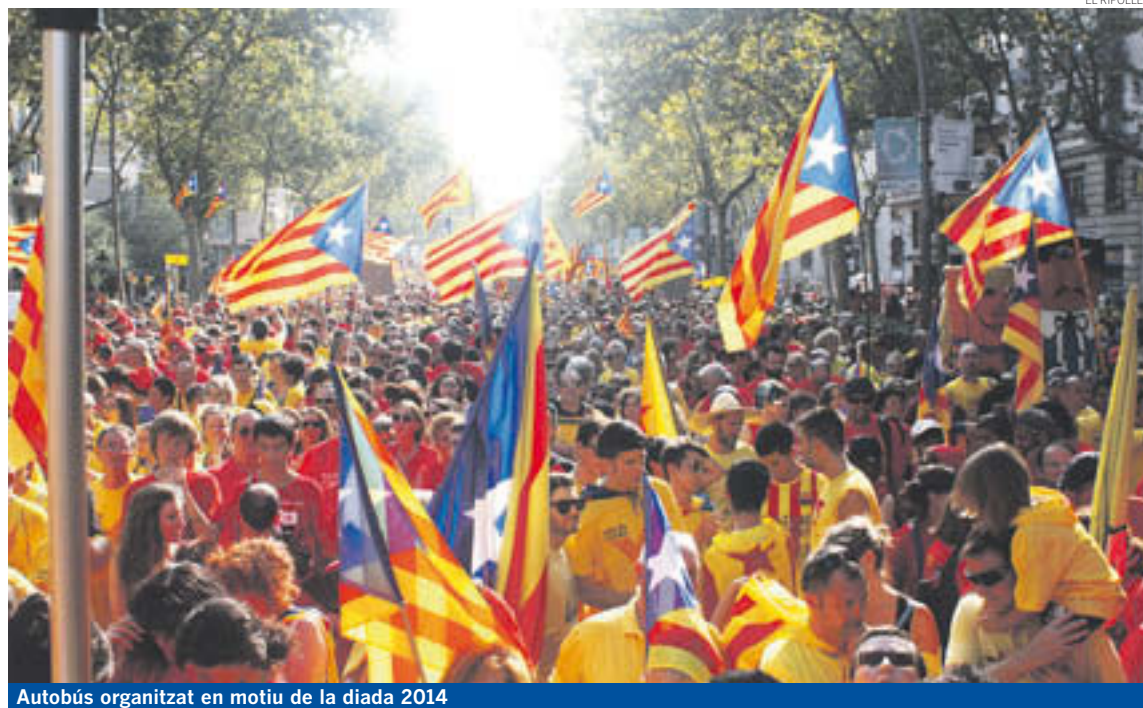
Autobús organitzat en motiu de la diada 2014