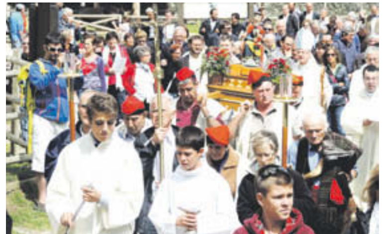
La processó dels Pastors va ser, com sempre, un element central de la festa