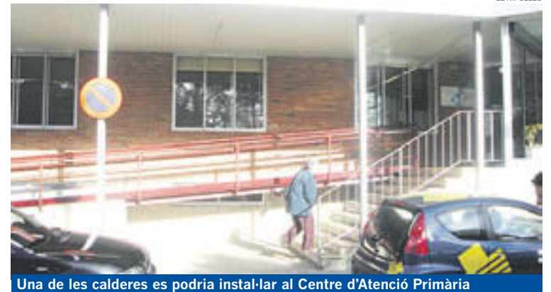
Una de les calderes es podria instal·lar al Centre d'Atenció Primària

A més, aprofitant la construcció d'un nou vas a la piscina municipal, també es va canviar la caldera per una que utilitzés biomassa. La nova instal·lació permet cobrir les necessitats de calefacció i aigua calenta a un equipament utilitzat pels ripollesos i ripolleses i també per la resta d'habitants de la comarca.