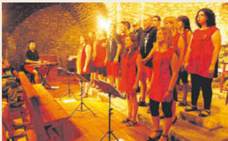
Els Jazz Quartet tocant a Toses