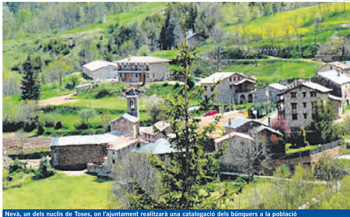
Nevà, un dels nuclis de Toses, on l'ajuntament realitzarà una catalogació dels búnquers a la població