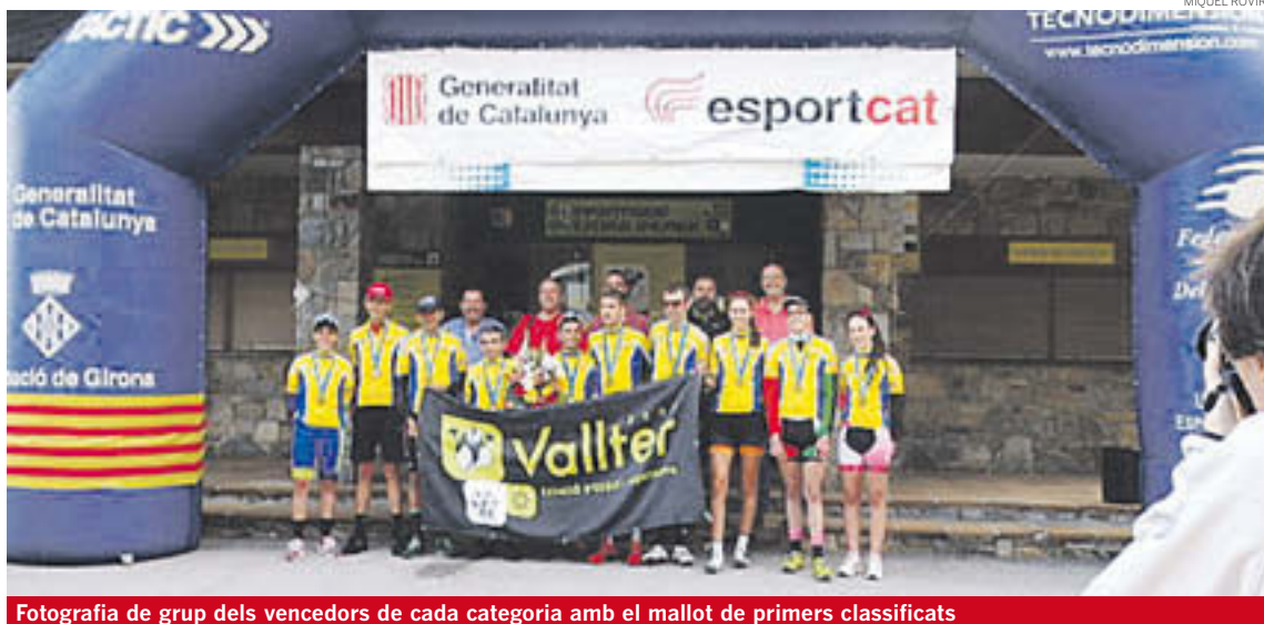
Fotografia de grup dels vencedors de cada categoria amb el mallot de primers classificats