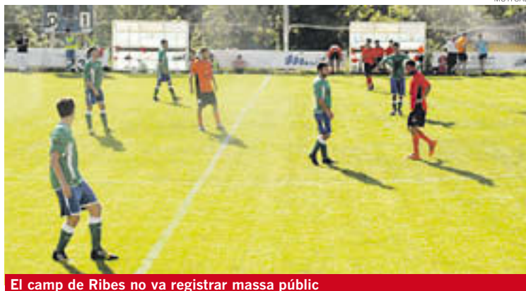
El camp de Ribes no va registrar massa públic