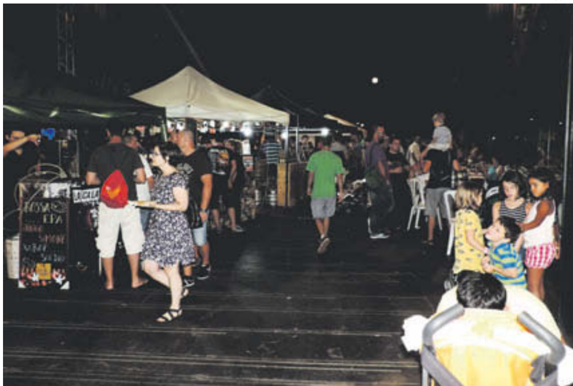
La fira va aplegar centenars de persones a la plaça de la Lira durant les dotze hores que va durar