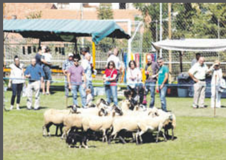
El concurs reuneix gossos d'atura de tot arreu