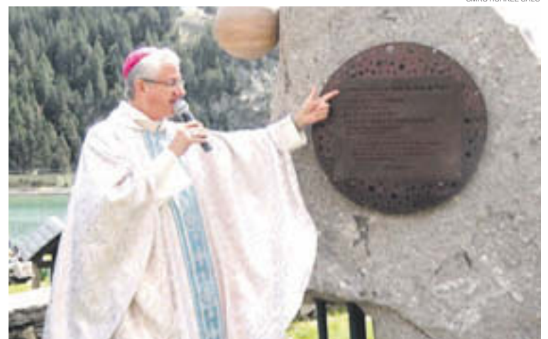
També es va inaugurar un monòlit-monument en honor al Papa Francesc