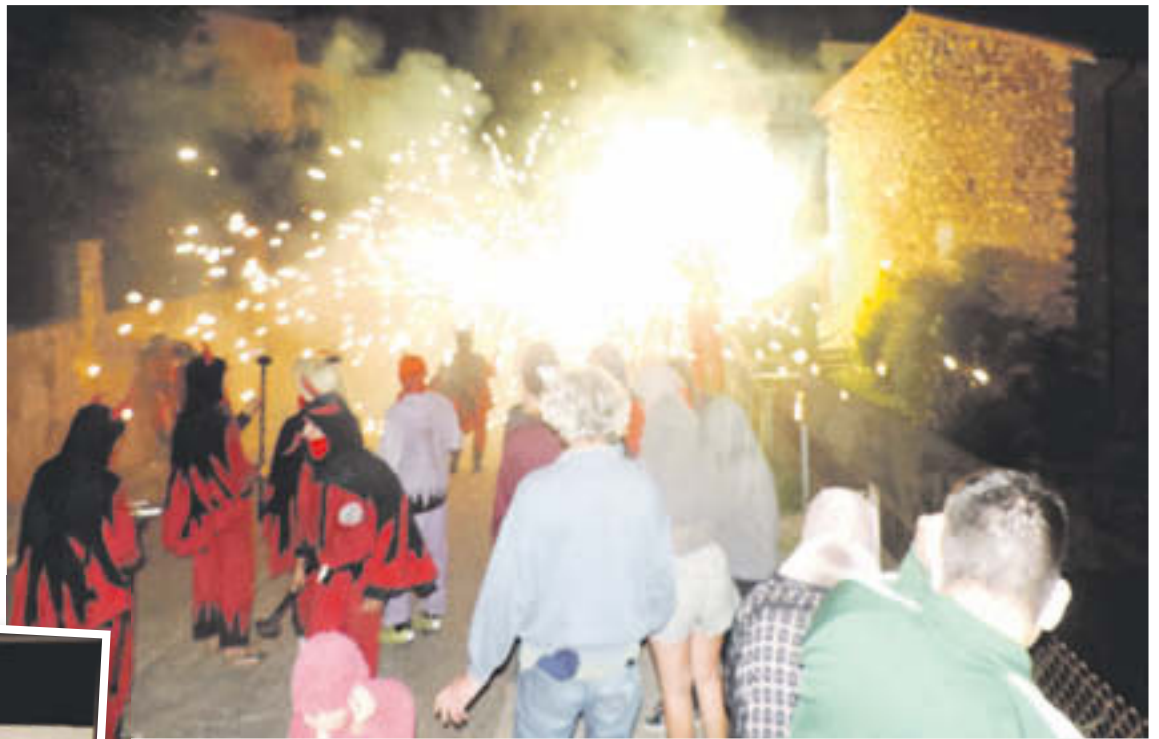
L'espectacular Correfoc va fer barrejar foc, llum i nit a Vallfogona