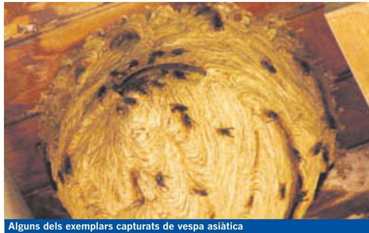
Alguns dels exemplars capturats de vespa asiàtica