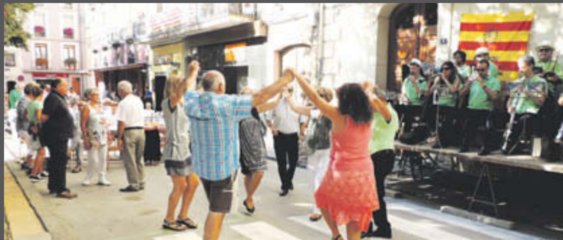
Les sardanes es van ballar durant la tarda al passeig Comte Guifré