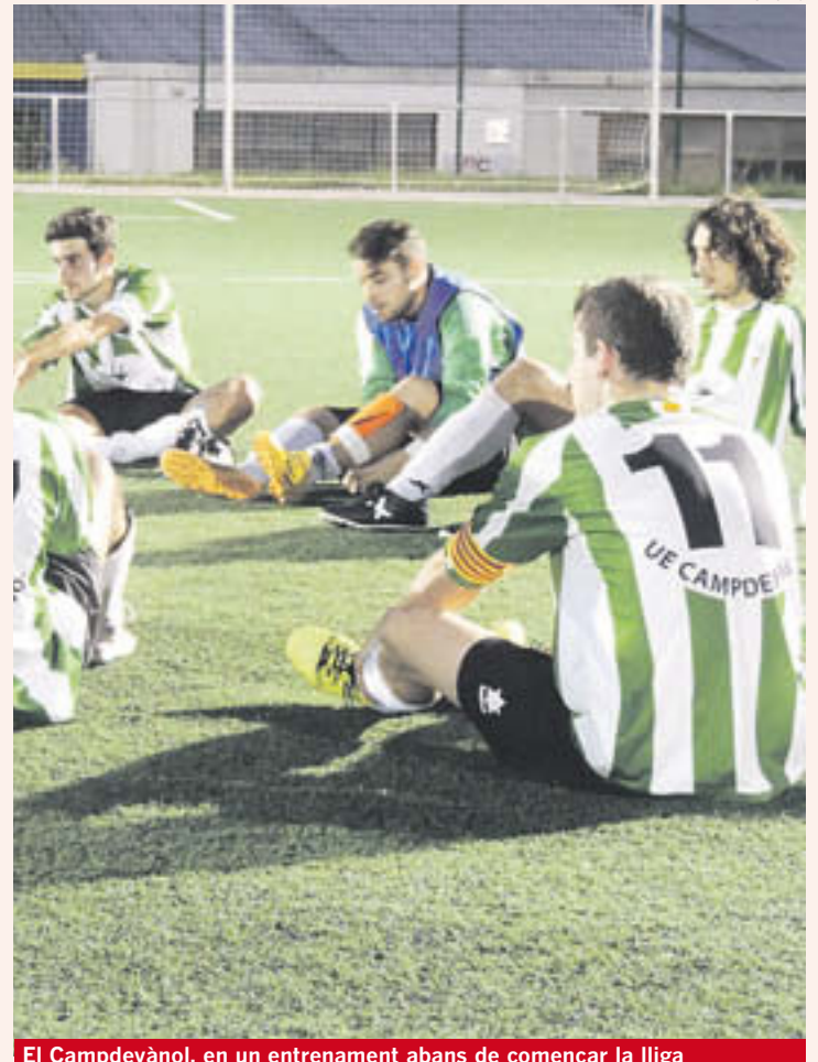
El Campdevànol, en un entrenament abans de començar la lliga