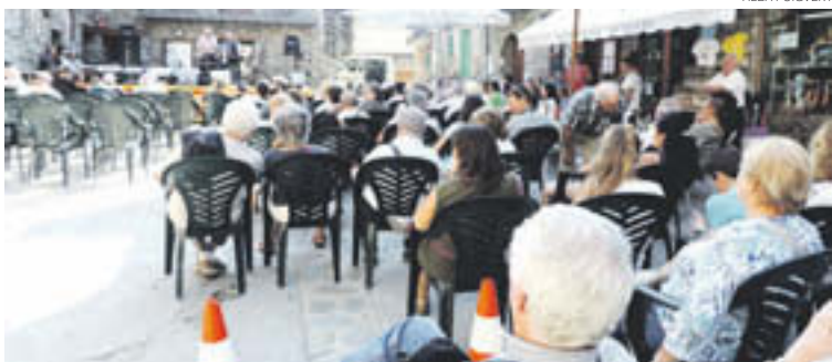
Aquesta ja és la XIV Trobada de Músics Sense Solfa a Setcases