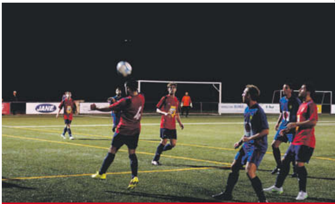
El repte del Camprodon és seguir optant a la part alta de la classificació a Segona

L'equip de Manel Puigvert ha jugat cinc partits i el Torneig Vila de Camprodon i, d'aquests, no n'ha perdut cap. En total, els camprodonins han sumat quatre victòries (0 a 5 contra l'Hostoles, 2 a 1 contra el Santa Pau, 3 a 1 al Vic Riuprimer, 2 a 3 a Campdevàrol). En l'últim partit de preparació abans de l'inici de lliga, el Camprodon va topar amb el Torelló (de Tercera), amb qui va empatar a zero a domicili. En el torneig, també va vèncer per 1 a 0 a l'UE Vic en 45 minuts d'enfrontament i va empatar a un gol contra el Sant Jaume de Llierca (amb qui va perdre als llançaments de penals).