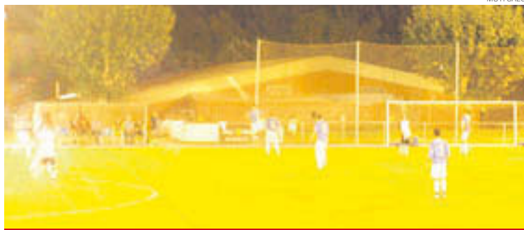
El Ripoll no va tenir opcions en el partit contra l'Abadessenc