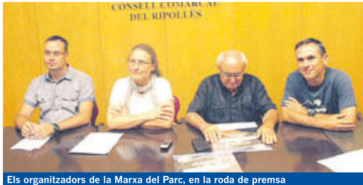
Els organitzadors de la Marxa del Parc, en la roda de premsa

La marxa realitzarà un recorregut entre els quatre refugis en dos dies, amb pernocta a Coma de Vaca o a Ulldeter. Està enfocada a un públic amant de la natura i amb ganes de descobrir els valors del Parc. Comptarà amb guies de natura de CEA Alt Ter i Guies Roc Blanc que aniran explicant els diferents paratges per