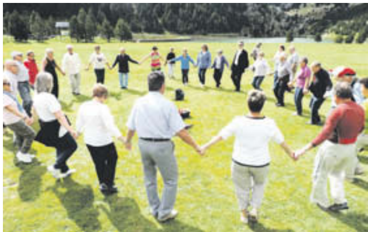
La festivitat de Sant Gil va aplegar persones i tradició