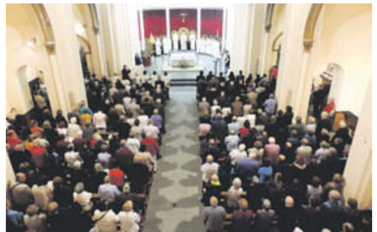
La missa, oficiada pel bisbe d'Urgell, va reunir molt de públic