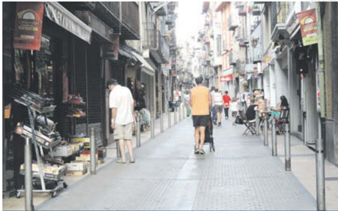
El carrer València, un dels punts més emblemàtics de Camprodon

Des del sector serveis de la Vall de Camprodon es comença a percebre una lleugera millora