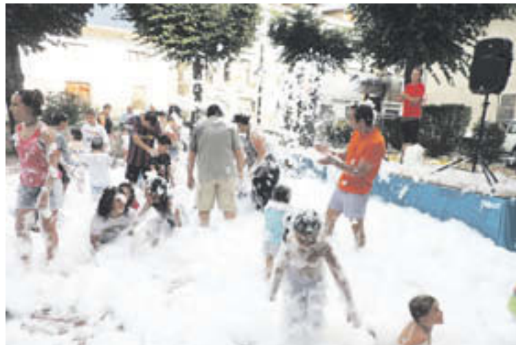
La festa de l'escuma és sempre una cita per a grans i petits

A La Ral ja van celebrar la Festa Major diumenge passat. L'habitual missa solemne va tenir lloc, acompanyada instrumentalment per Eudald Jordà. A la mateixa tarda, una bona dosi d'havaneres a càrrec del grup Terral, amb rom remat, va continuar la jornada. Per rematar-ho tot plegat, aquell vespre, a l'entrada de fosc, van espetegar la traca i el castell de focs artificials per deixar un bon regust de boca al veïnat de La Ral i que tots plegats fessin pinya un any més.