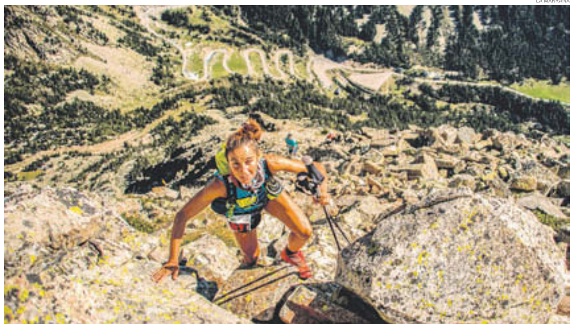
Corredora en un moment de l'ascensió

Tot plegat, un rècord de participants en la prova atlètica de muntanya que pren el nom del Coll de la Marrana, lloc de pas durant la cursa.