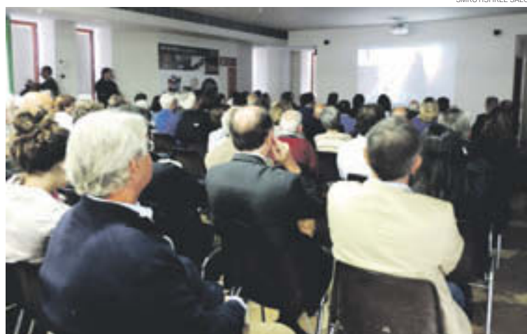
Projecció del documental sobre l'exili de la marededéu de Núria durant la Guerra Civil