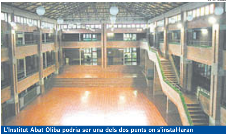
L'Institut Abat Oliba podria ser una dels dos punts on s'instal·laran