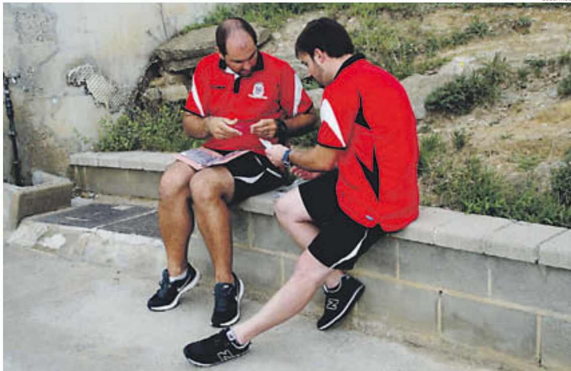
L'equip tècnic de l'Abadessenc haurà de pensar molt bé qui i com fa jugar els primers partits de lliga