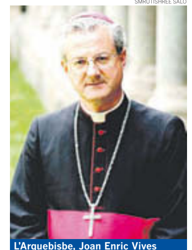
L'Arquebisbe, Joan Enric Vives

« lluïta democràtica és lícita », però sempre s'ha de guardar « la mesura i les formes ».