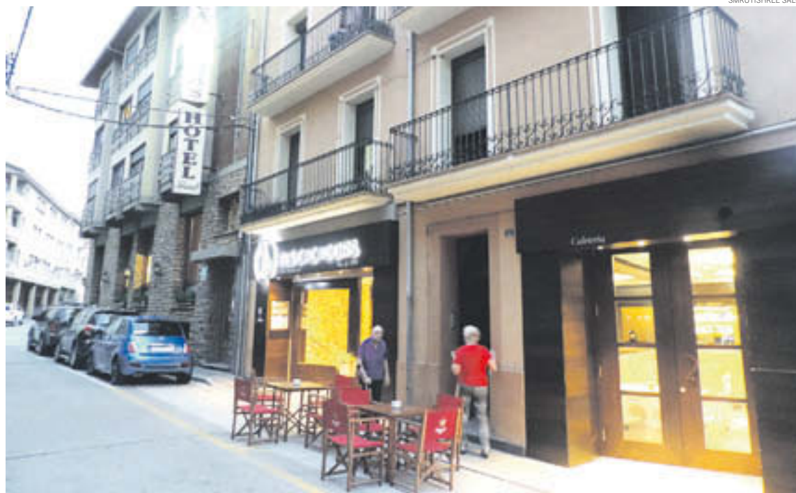
L'hotel Els Caçadors, de Ribes de Freser, es mostra satisfet de l'ocupació registrada a l'estiu

La tipologia d'estades que registra aquest establiment de Ribes de Freser « cada cop són més curtes », ja que el seu client prové, principalment, de la zona de l'àrea metropolitana.