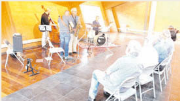
Els Yes The Music, en la seva actuació a Planoles

El cicle de concerts es tancarà dissabte 12 de setembre, a l'Església de la Mare de Déu del Carme, amb el pop-rock, reggae i soul dels Hati-Sama, provinents de la Cerdanya.