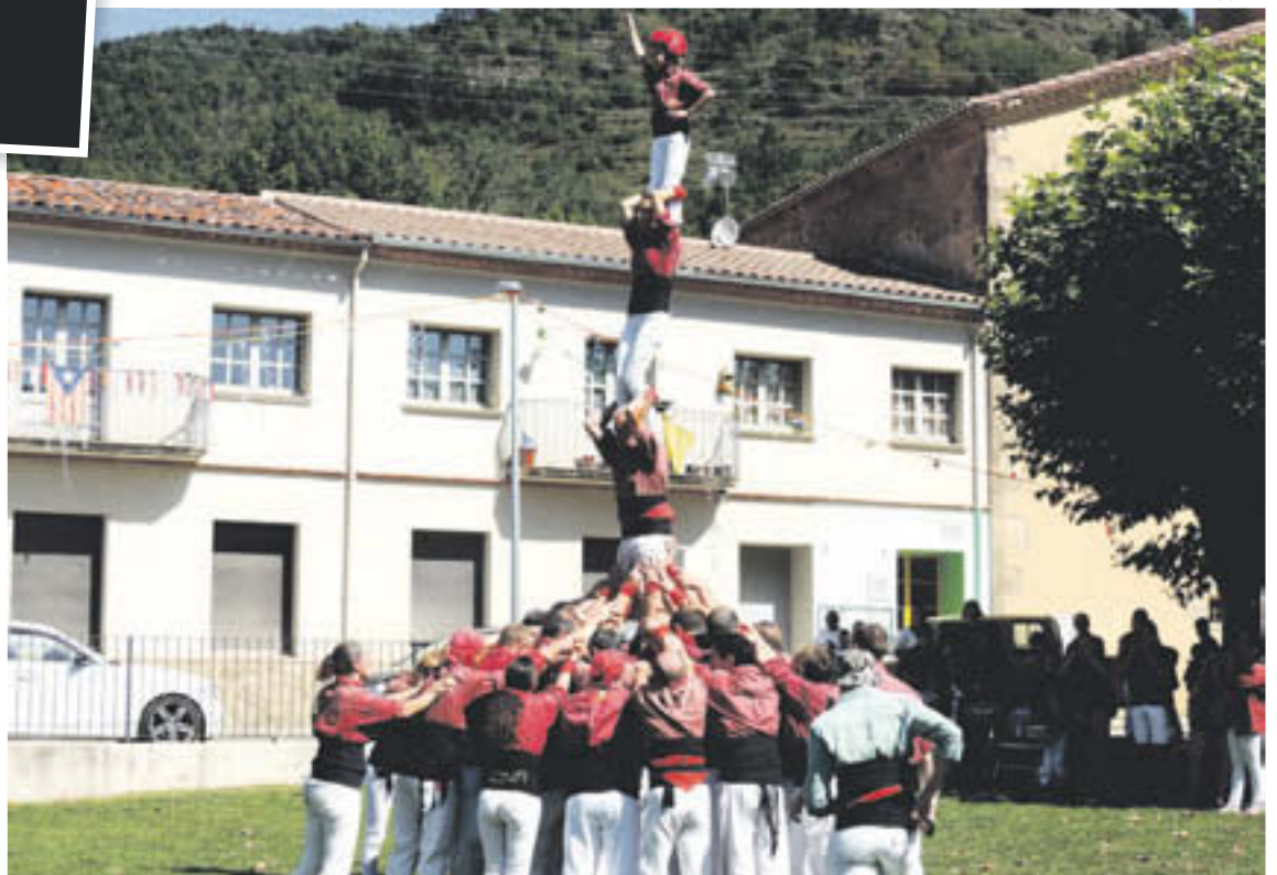
Els castellers també van tenir el seu protagonisme a la Festa Major de Vallfogona

Vallfogona ha mostrat i demostrat llum, foc i colors durant aquesta Festa Major, i seguirà mostrant-los, esperem, durant molts anys més.