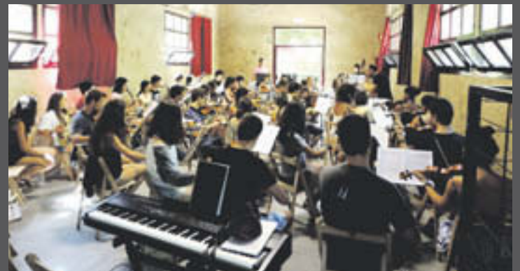
Un assaig de l'Escola de Música a l'antic escorxador de Sant Joan