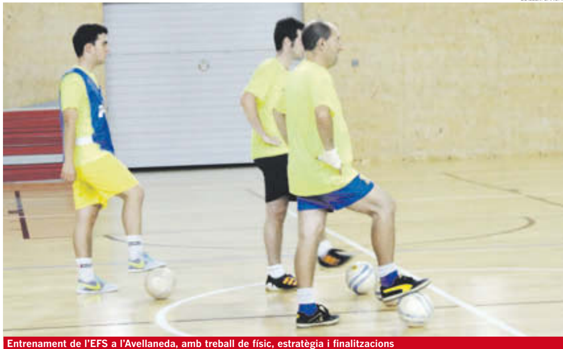
Entrenament de l'EFS a l'Avellaneda, amb treball de físic, estratègia i finalitzacions